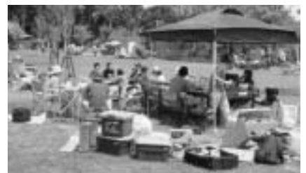
家族や友だちと楽しくキャンプ

くわしくは ~ は市体育館(☎26-72 51) は生涯スポーツ課(☎20-1584) は坂田ケ池総合公園管理事務所(☎29-1161)へ。