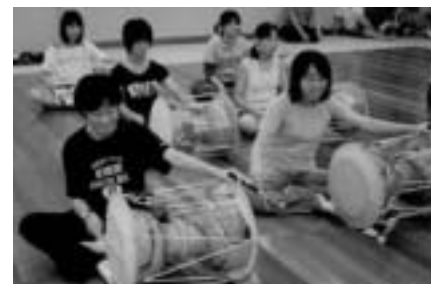
韓国の伝統楽器にも挑戦

市国際交流協会では、夏休みに友好都市韓国・井邑市とのホームステイ交流に参加する中学生を募集します。 歴史的・文化的にも関係の深いお隣の国・韓国を知る良い機会です。ことしの夏休みは韓国を体験してみませんか。 期間=8月5日(木)~9日(月)(4泊5日・事前事後に4回の研修を予定) 内容=ソウル市内見学と井邑市でのホームステイ(2人1組で2泊) 対象=市内に住む中学2・3年生 定員=12人 参加費=50,000円(パスポートの取得費や旅行保険などは各自で負担) 選考方法=作文(1次試験)と面接(2次試験・6月5日(土)) 申し込み方法=5月21日(金)(必着)までに国際交流をテーマにした作文(400字詰め原稿用紙2枚程度)に住所・氏名・学校名・保護者氏名・電話番号を書いて市国際交流協会(〒286-8585 花崎町760)へ くわしくは同協会事務局(市広報課内・☎23-3231)へ。