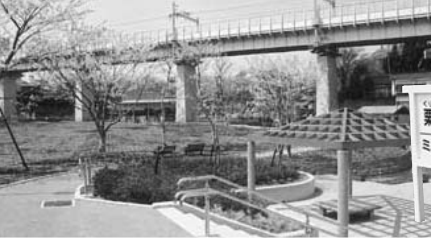
生まれ変わった栗山公園

中心市街地の活性化事業として再整備を進めていた栗山公園が、既存の蒸気機関車 D51のほかに、親水施設や桜の広場、ミニ蒸気機関車用の線路などを設置した新しい公園に生まれ変わりました。