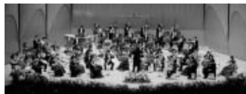
オーケストラによる優雅な演奏も

女声合唱な りた、成田 楽友協会合 唱団 入場料 A 席2,000 円、B席1, 000円 前売り開始 2月1日 (日)