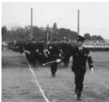
市制施行50周年を記念し行進が