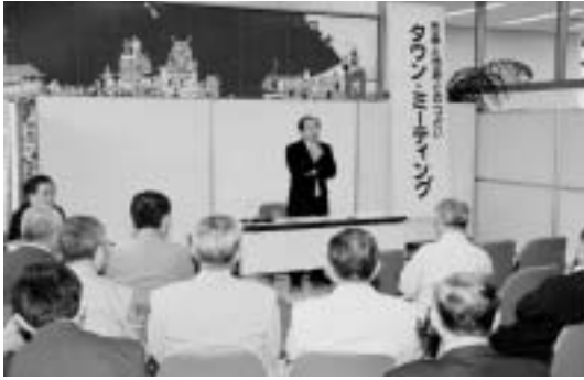
みなさんの活発な意見を

また、いただいた意見や提案それらの検討結果は、市民と市の共有の情報としてみなさんにお知らせしていきます。