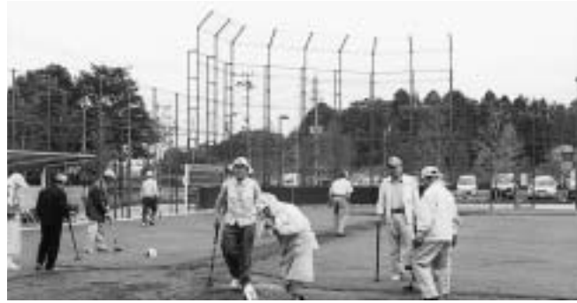
整備された芝のグラウンド

少年野球・グラウンドゴルフ・フットサルなどに利用できる、成田クリーンヒル多目的広場が整備され、貸し出しを行っています。スポーツの秋にぜひ、利用してみたいかがですか。 申し込み方法⇒直接または電話で成田クリーンヒル管理事務所へ 申し込み期間⇒利用日の前月1日～前々日