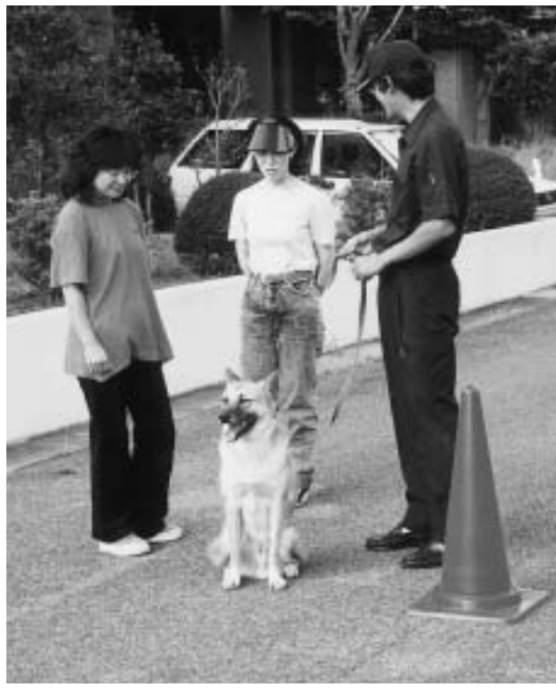
ペットのしつけも飼い主の責任

しかし、飼い主の身勝手から捨てたり、処分に出したりする例などが少なくありません。このようなことを無くし「動物愛護精神の普及・啓蒙を目的に「動物愛護週間」が設けられています。