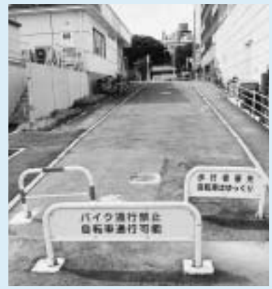
くわしくは道路維持課(☎20-1551)へ。

緑道は歩行者と自転車の専用道路です。バイクの乗り入れは禁止ですので、絶対にやめましょ。