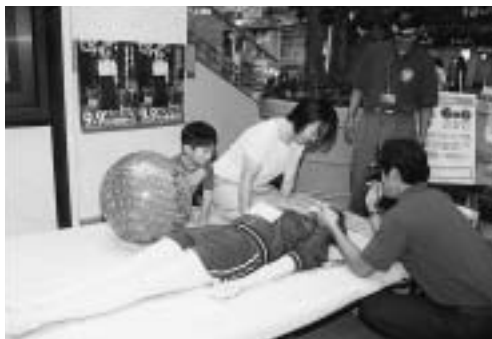
応急手当てを覚えよう

人が倒れて呼吸が停止してから数分で心臓も停止します。2分以内に人工呼吸や心肺蘇生の応急手当を始めると、ほとんどの人が助かるといわれています。また、5分後になると生存率は約25%、4人に1人しか助からないとされています。