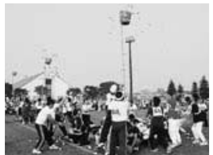
力を合わせて目指せ新記録

期日 = 10月5日(日) 会場 = 市陸上競技場 種目などについては区・自治会・町内会へ回覧板でお知らせします。参加申し込みは、一緒に回覧する申込書に記入してください。昼休みにはだれでも参加できる企画もあります。記念品も多数用意していますので奮ってご参加ください。くわしくは生涯スポーツ課(☎20-1584)へ。