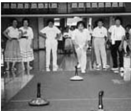
狙いを定めてストーンを滑らす(ユニカール)

日時 = 9月7日(日) 午前9時30分~正午 会場 = 市体育館アリーナ 実施種目 = ユニカール・インディアカ・フォークダンス・ペタンク・スポーツチャンバラ・輪投げなど 参加費 = 無料 参加を希望する人は、当日直接会場へお越しください。くわしくは生涯スポーツ課(☎20-1584)へ。