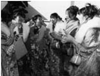
久しぶりの再会に笑顔がこぼれる