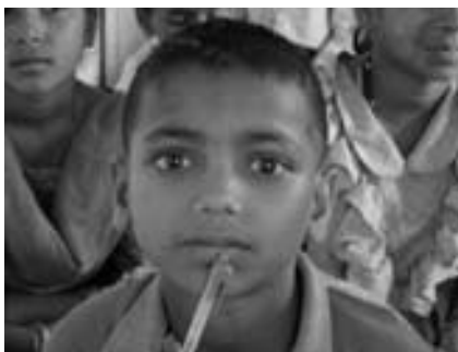
ネパールの子どもたちに教育を

方法=募金や書き損じハガキを、小・中学校や公民館、協会事務局(市役所5階生涯学習課内)の窓口へ備え付けの募金箱・書き損じハガキ回収箱へ大口の支援が可能な団体は協会事務局(生涯学習課・☎20-1583)へご連絡ください。9月上旬までに連絡いただいた場合には、支援団体として現地にも名前が残る場合があります。くわしくは同事務局へ。