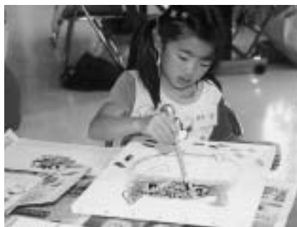
うまく描けたかな? (油絵教室)

申し込みは7月10日(木)までに直接または電話で加良部公民館(☎28-7961)・月曜日は休館へ。