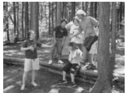
大自然と友だちに(昨年のつどい)

申し込みは7月4日(金)までに住所・氏 名・学校名または勤務先・学年(年齢) を電話で生涯学習課(☎20-1583)へ。