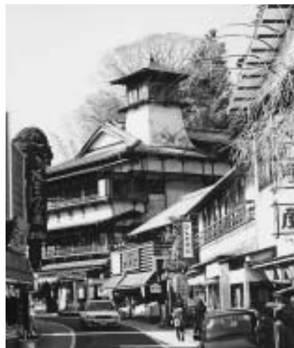
街なみ部門・市長賞の「望楼のある旅館」