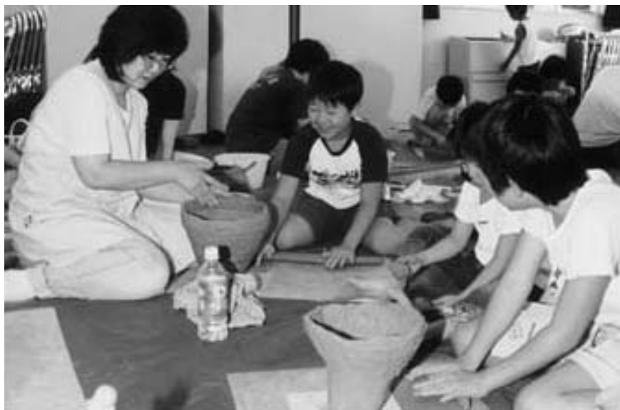
夏休み親子土器・土偶作り教室