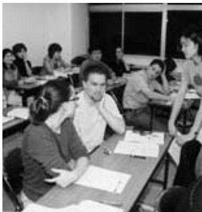
外国人のための日本語教室