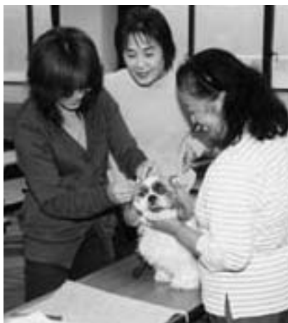
犬のトリミング教室

掛け軸・表装入門教室 5月～8月(5回)/成人 夏休み子どもつり教室 7月～8月(1回)/小学生 ビーズ玉作品教室 10月～12月(7回)/成人 生きがいセミナー 2月(1回)/高齢者