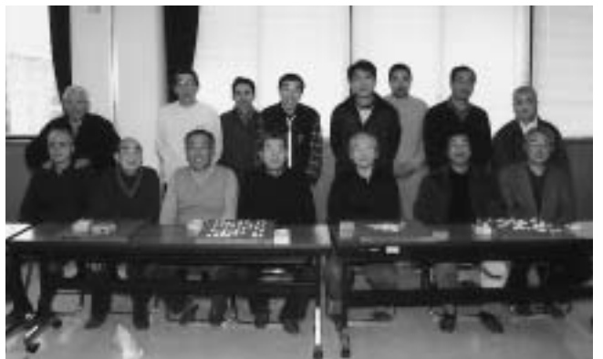
将棋って、奥が深いですね

勝つために研究をします。序盤の駒組み、中盤の駒のさばきあい、玉を詰ます終盤といろいろな場面があります。局面によっては駒の動き、駒の損得、速度などの攻守のバランス感覚がとても大切です。たった一枚の「歩」が勝負を分けることもあります。将棋って本当に奥が深いゲームですね。