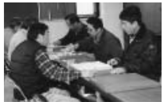
中盤の難所、自然と力が入ります

わたしたちは、毎週日曜日、加良部公民館で、日本古来のゲームである将棋を指している仲間です。メンバーは、30代から90歳になる人もいます。