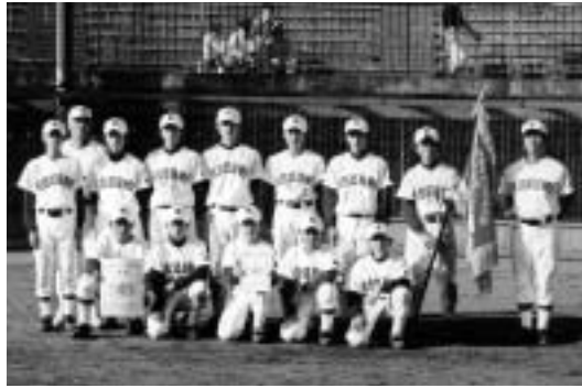
目標は県大会の優勝旗

気と、チームワークの良さを生かし、モットーである素直・反省・謙譲・奉仕・感謝の大切な「五つの心」を忘れずにがんばりたいと思います。