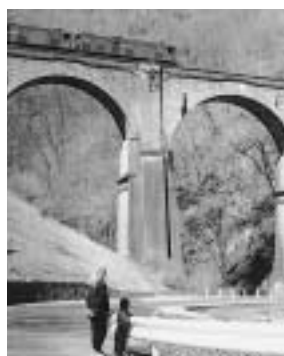
親せきの子を連れてめがね橋へ(昭和35年撮影)

わたしの家は国道18号線の碓氷峠の上り口にあり、ドライインと小さな旅館を営んでいました。立ち寄るのは、もっぱら峠を上り下りするなじみの客で、情報交換の場として