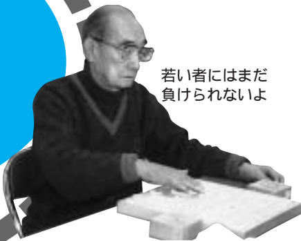
若い者にはまだ負けられないよ