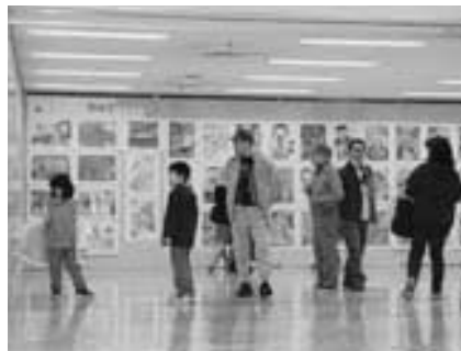
お父さん、これ上手だね

「第5回国際子ども絵画交流展」が次のとおり開催されます。 世界各地の子どもたちと市内の子どもたちの絵画作品を通じて、お互いの生活や文化について理解を深め合ひましょう。 日時 = 10月26日(土)~11月17日(日) 午前9時~午後3時30分 会場 = 成田山新勝寺大本堂第二講堂 入場料は無料です。くわしくは生涯学習課(☎20-1583)へ。