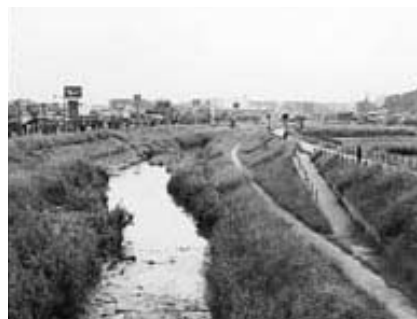
水辺は安らぎの散歩道