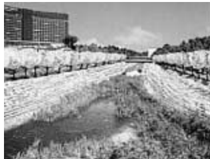
サクラ咲く川辺に(植樹後のイメージ)

植樹費用および植樹後の維持管理費 用はすべてNAAが負担します。くわし くはNAA地域共生部(☎34-5084)へ。