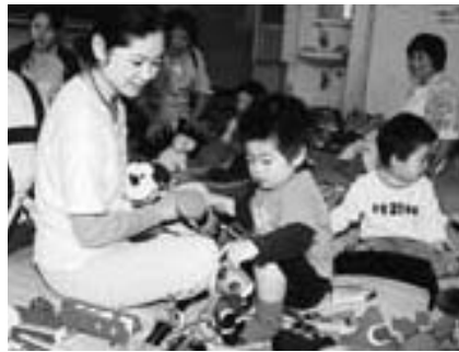
あなたの経験で子育てを応援