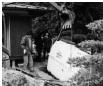
補助金を活用して快適な生活環境を

約期間の終わりの日が属する年度内（ただし、終わりの日が3月31日のときは翌年度）です。