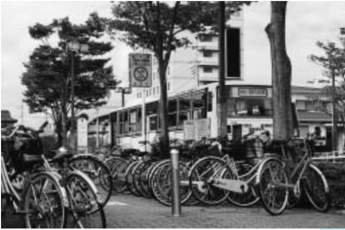
歩道に放置された自転車