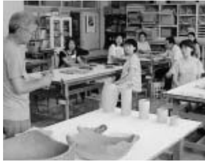
イベントや学びの情報がいっぱい