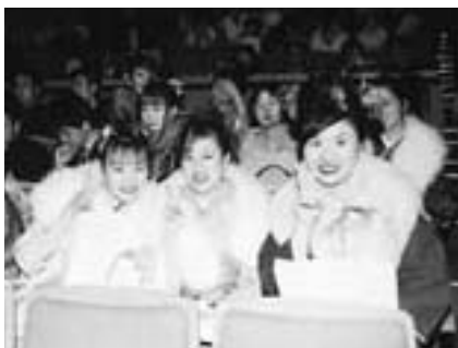
決めのポーズはやっぱりピース

成人式実行委員会を組織します。対象者で実行委員になってみたい人は、8月30日(金)までに生涯学習課(☎20-1583)へ連絡してください。