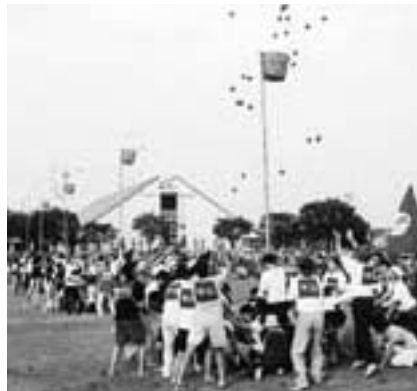
みんなの力で目指せ優勝

期日 = 10月6日(日) 会場 = 陸上競技場(中台運動公園) 競技種目 = 区・自治会・町内会への回覧をご覧ください 参加方法 = 回覧に添付の申込書に記入 昼休みにはだれでも参加できる種目も企画しています。記念品も多数用意していますので奮ってご参加ください。くわしくは生涯スポーツ課(☎20-1584)へ。