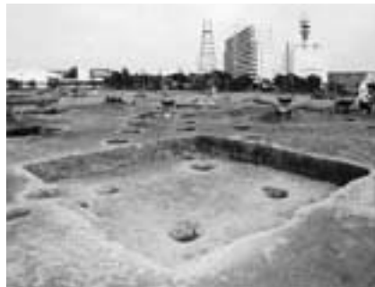
竅穴住居跡が広がる台方下平 遺跡

現地は駐車場がありませんので車の来場はご遠慮ください。くわしくは(財)印旛都市文化財センター(☎043-484-0126)へ。