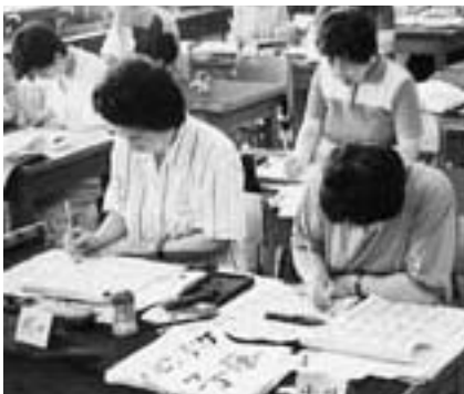
筆を執ると心が落ち着きます

日時=9月7日~12月7日の毎土曜日(9月 21日、10月19日、11月9日・23日を除 く全10回) 午後2時~4時 会場=加良部公民館 内容=すぐに役立つ実用的な書道を学ぶ 対象=成人の初心者 定員=20人(応募者多数は抽選) 参加費=1,000円(教材費) 申し込みは8月23日(火)正午までに直 接または電話で加良部公民館(☎28- 7961・月曜日は休館)へ。