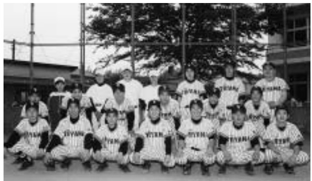
優勝旗奪還を目指せ

地区大会に優勝し、県大会に出場することです。おとしは、優勝しましたが、昨年は2回戦で負けてしまったので、ことしはぜひ雪辱を果たしたいと思います。監督の「少ないチャンスをものにしろ」「最後まであきらめるな」の言葉を心掛け、がんばりたいと思います。応援をお願いします。