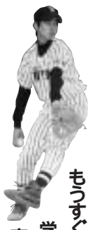
学校総合体育大会の

チームは、谷萩原のバッテリーを中心に、守備には結構自信があります。その反面、バッティングとバント・走塁などの小細工が少々苦手です。昨年は、大会に出ても初戦敗退ばかりでしたが、ことしになっていくつかの大会で好成績を残せるようになってきました。