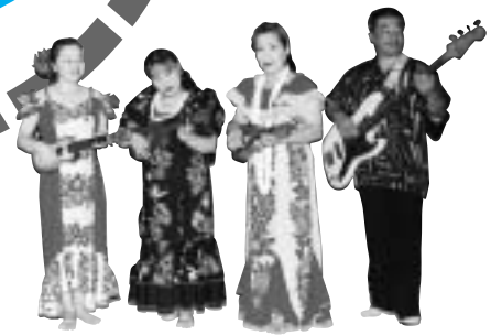
気分はワイキキビーチ