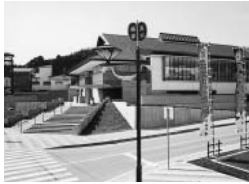
平成9年にオープンした横綱記念館