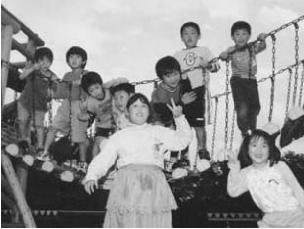
週5日制でゆとりある教育を

街地活性化事業 架空線地中化事業など、『観光と産業の振興』では、坂田ヶ池総合公園整備事業、善民まつり負担金、善民ロード整備事業、緊急地域雇用創出特別基金事業など、『教育文化行政の振興』では、個性を生かす教育推進事業、久住中学校移転関連事業、小・中学校外国人英語講師派遣事業など、『環境行政の推進』では、いずみ聖地公園拡張整備事業、新ごみ処理施設広域化計画策定事業、南三里塚駒井野線整備事業などに取り組んでいきます。