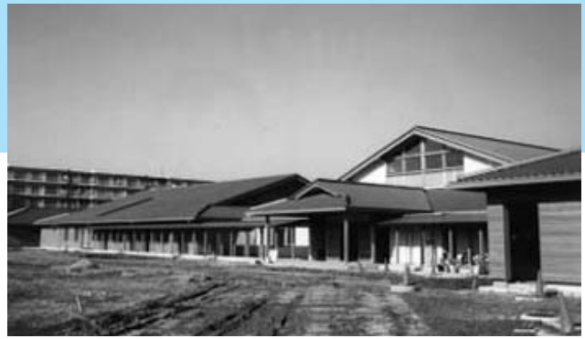
7月にオープン予定の「保健福祉館」