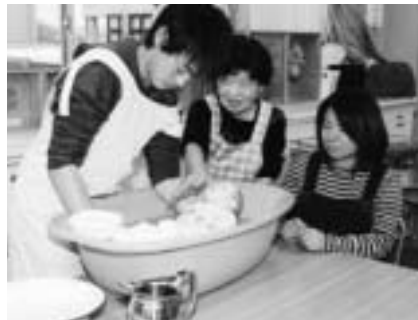
生まれてくる赤ちゃんのために