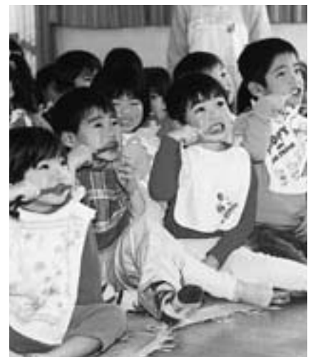
きれいに磨こうね

応募方法=ハガキ(作文は封書)に住所、氏名、電話番号、生年月日(「母と子のコンクール」は母子ともに)を書いて保健センター(〒286-0036加良部3-3-1)へくわしくは同センター(☎27-1111)へ。