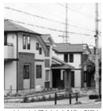
マイホームを購入したら制度の利用を

または購入した場合、次の条件で利子の補給をしています。なお、公庫でも、年金融資・財形融資・リフォーム融資は対象になりません。