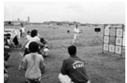
楽しい催しがたくさん待っています

▶会場への交通=16日(日)と22日(土)は第2旅客ターミナルビルの立体駐車場前から各会場へシャトルバス(無料)が運行されます。駐車場の混雑が予想されますので、空港への交通機関はなるべく電車やバスをご利用ください。空港へ入場する時には、運転免許証など身分を証明するものが必要です。くわしくは空の日事務局(☎32-0984 または☎34-5094)へ。