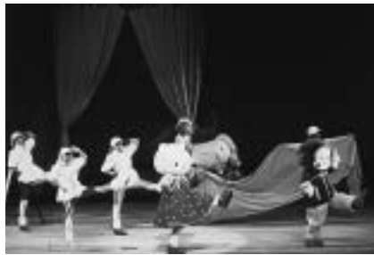
©76,'92,'96,'01 SANRIO CO., LTD. APPROVAL NO.P1508072

▶日時=12月9日(日)午前11時・午後2時(2回公演・開場は30分前) ▶会場=国際文化会館大ホール ▶内容=第1部(45分)...「妖精フロレンス」、第2部(30分)...「イツ・ア・ミュージカル」(出演はハローキティ・パッドぱつ丸・マイメロディ・ディアダニエルなど) ▶入場料=2,000円(全席指定・3歳以上有料) ▶前売り開始日=9月22日(土) ▶前売り所=国際文化会館・ヨネダカメラ店・ジャスコ成田店1階サービスカウンター・ボンベルタ百貨店成田4階サービスカウンター・イオン成田SC2階サービスカウンター・日本航空生活協同組合成田地区売店 くわしくは国際文化会館(☎23-1331)へ。