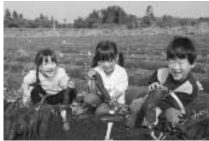
ぼくの顔より大きいよ!