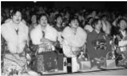
思い出に残る成人式に

平成14年の成人式の企画・運営に携わる実行委員を募集します。あなたの力で、思い出深い成人式にしてみませんか。 ▶対象 = 昭和56年4月2日～昭和57年4月1日に生まれ、成田市で成人式を迎える人 ▶募集人数 = 男女各10人 申し込みなどくわしくは生涯学習課(☎20-1583)へ。