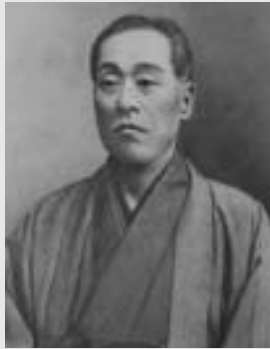
沼の権利をめぐり、長沼村と周辺の村で対立した長沼事件を解決した福沢諭吉(長沼区所蔵の肖像画)