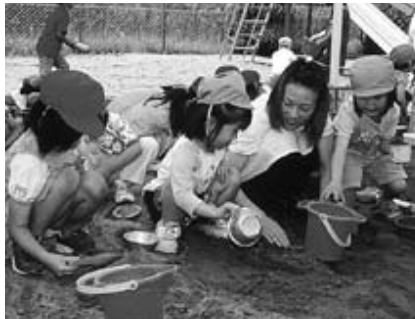
先生、トンネル作ろうよ!