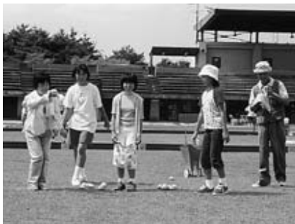
目標球の近くに投げれば勝ち(ペタンク)