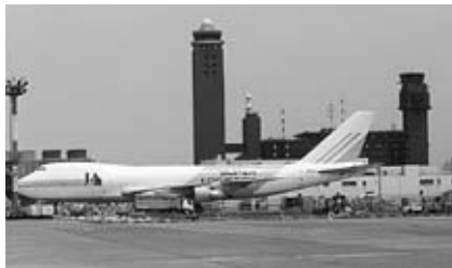
空の安全を守る航空管制塔

新東京空港事務所では、「空の日」「空の旬間」の記念行事として、空港・管制塔見学会と航空管制体験教室を開催します。 ▶日時＝9月22日(土)午前10時～午後0時40分 ▶対象と定員＝見学会…小学生以上・50人、体験教室…高校生・15人(いずれも申し込み多数は抽選) ※申し込みは8月31日(金)(当日消印有効)までに、往復はがき(見学は1枚4人まで、体験教室は2人まで)に住所・氏名・年齢・学校名(学年)または職業・電話番号(返信用にも住所・氏名)を書いて、東京航空局新東京空港事務所総務課(〒282-8602 古込字込前133・☎32-0909)へ。