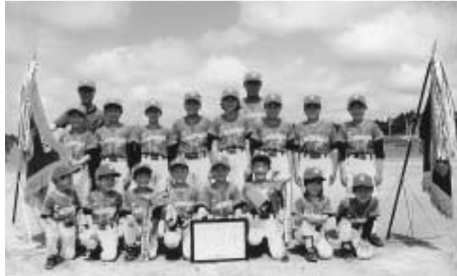
全員で目指す県大会連覇(今年の優勝旗を手に)