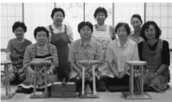
秋の作品展に向けて頑張っています

失われつつある手作りの美しさや温かさを感じ、古典でありながらモダンな味があります。友人へのプレゼントにも大変喜ばれています。今年の2月に東京の銀座「ラ・ポリーラ」で作品の展示会と販売を行い、好評でした。今は11月に行われる公民館まつりに向け、いろいろな作品にチャレンジしているところです。