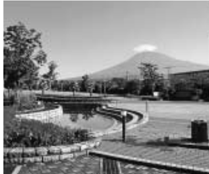
雲の形で天気が分かります

私のふるさととは静岡県の富士宮市です。名前で分かるように、富士山のふもとに広がる町で、全国の浅間神社の総本社「富士山本宮浅間大社」があることでも知られています。町の中心は富士山のふもとにありませんが、市の区域はなんと山の頂上まで。山の約4分の1は富士宮市です。私の小さいころは、豊富なわき水を利用して、あちこちに鱒の養殖場がありました。それから、山頂に掛かる雲の形を見れば次の日の天気に分かりましたね。また、地元の小学校では、6年生の夏休みに必ず富士登山をします。とにかく生活の中にも富士山がありました。浅間神社では春と秋に大祭があり、出店がたくさん出るのです。小さいときはとても楽しみでした。神社には