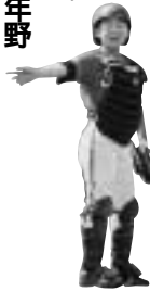
守備の要がサインに指示

野球千葉県大会と千葉県少年野球大会の二つの県大会に優勝しました。ことは、優勝メンバーが抜けて苦しいですが、監督やコーチの言うことをよく聞いて、チームワークの良さを8月から始まる県大会で優勝したいと思えます。応援してください。