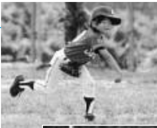
三塁線はおれに任せろ