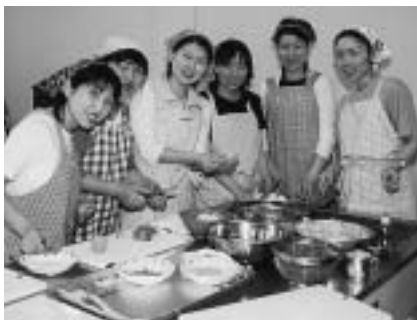
友達もできました