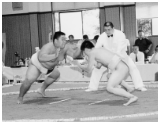
関東中学生相撲大会

児童・生徒の健康・体力の増進に向けて、運動部活動を継続・充実するために、専門的な外部指導者・機関の活用など市体育協会との協力・連携を進めます。水泳、剣道、柔道などの個人種目については、近隣校との合同運動部活動を計画するなど、新しい部活動のあり方を検討します。