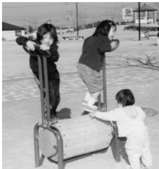
公園で遊ぶ子どもたち

近隣公園や街区公園の設備を充実するとともに、子どもの遊び場の整備も推進し、子どもたちが気軽に遊べる場所を提供します。