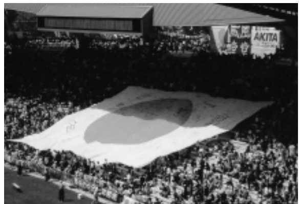
ワールドカップサッカー大会