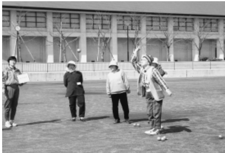
みんなで楽しむペタンク

段差の解消や手すりの設置など，高齢者や障害者が利用しやすい環境を整備するために，スポーツ施設のバリアフリー化を推進します。