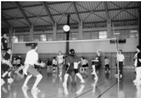
ソフトバレーボールを行う市民

総合型地域スポーツクラブが未結成の地域においては、成田市体育協会と連携しながら、各地区体育協会や健全育成協議会等のスポーツ活動を支援するなど、総合型地域スポーツクラブ育成の基盤整備につとめます。