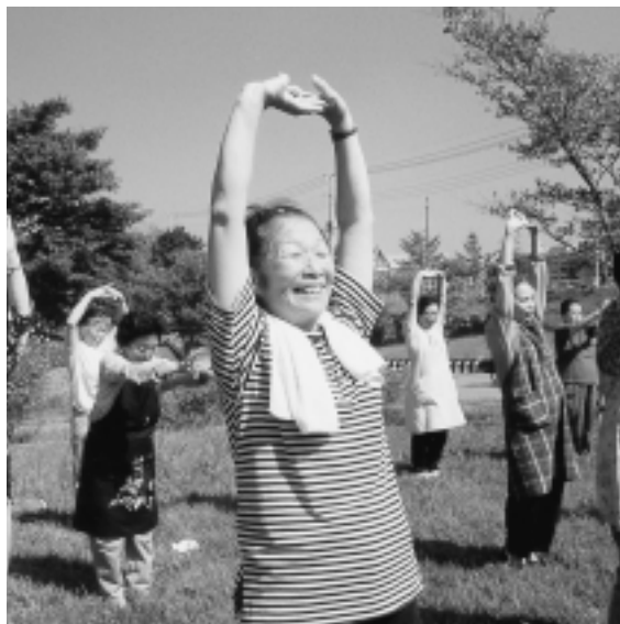
身近な公園で健康づくり

各地区内の身近な公園の中に、健康づくりのため、簡易なスポーツ遊具などを配置し、子どもから高齢者までが楽しみながら健康の保持増進を行える場を提供します。