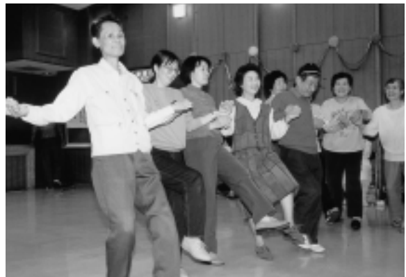
ダンスで楽しむ市民