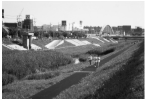
ジョギングを楽しむ市民