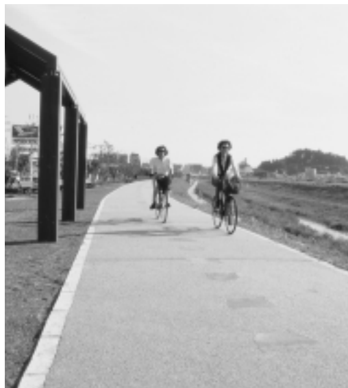
サイクリングを楽しむ市民

里山や水辺を通るハイキングルートの整備を促進し，子どもからお年寄りまでが安心してハイキングを楽しめる環境づくりを行います。