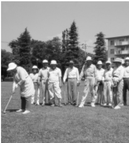
グラウンドゴルフの指導を受ける高齢者

現在実施されている障害者レクリエーション・スポーツ大会など、高齢者や障害者のためのスポーツ大会の開催や参加の支援を行います。また、既存のスポーツ大会に、高齢者や障害者も一緒に参加できるような環境づくりを推進します。