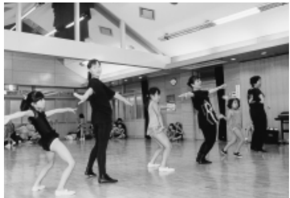
大人と子どものジャズダンス教室