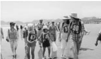
はだして歩くと気持ちがいいね