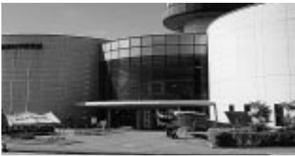
屋外にも飛行機の展示が