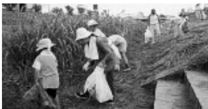
家族みんなで川の清掃