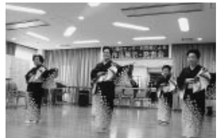
学習成果を発表する機会も