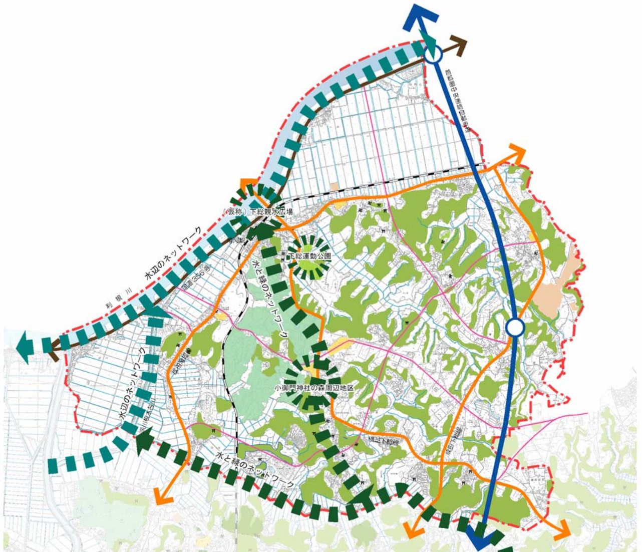
図 下総地域の緑化推進方針