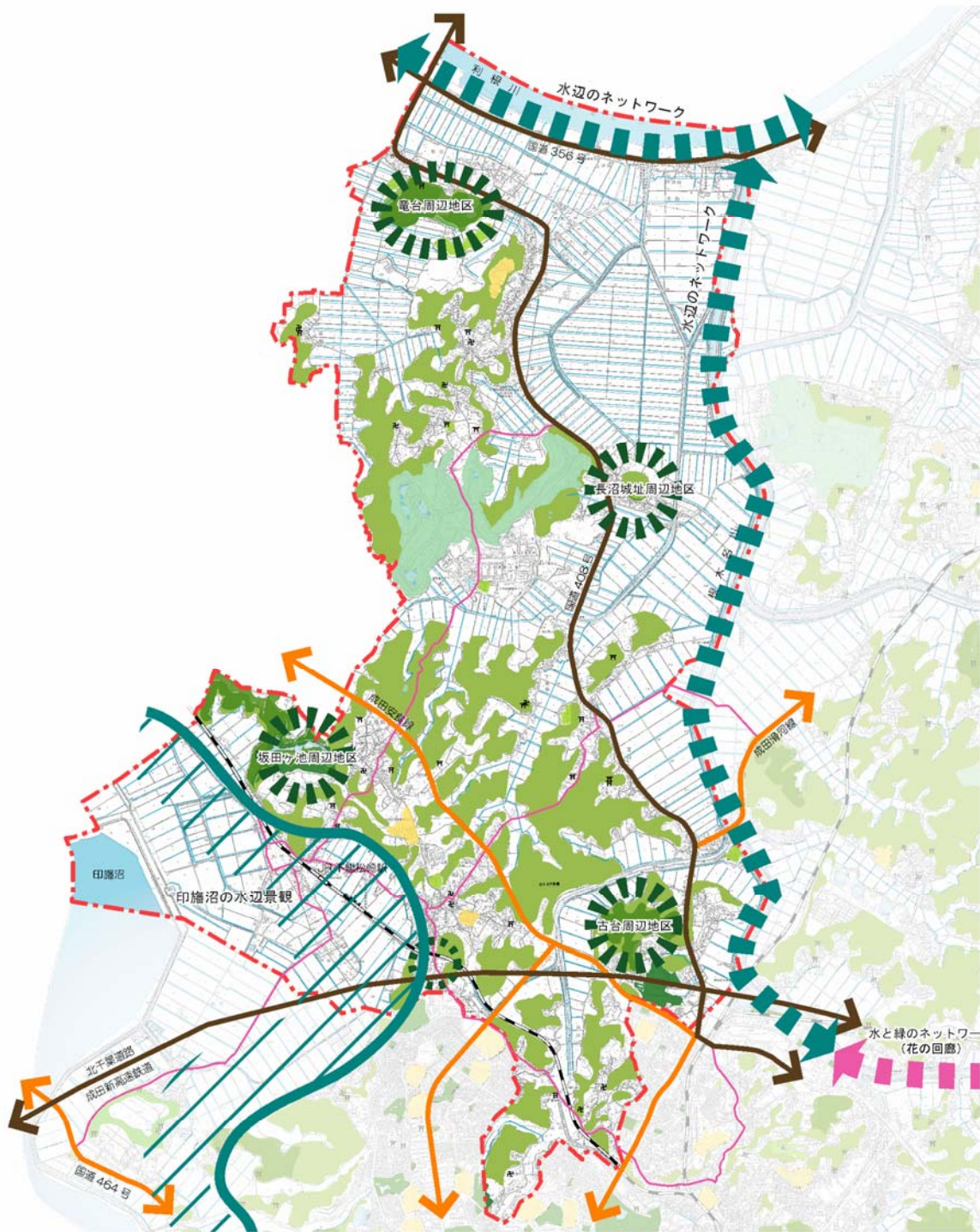
図 八生・豊住地域の緑化推進方針