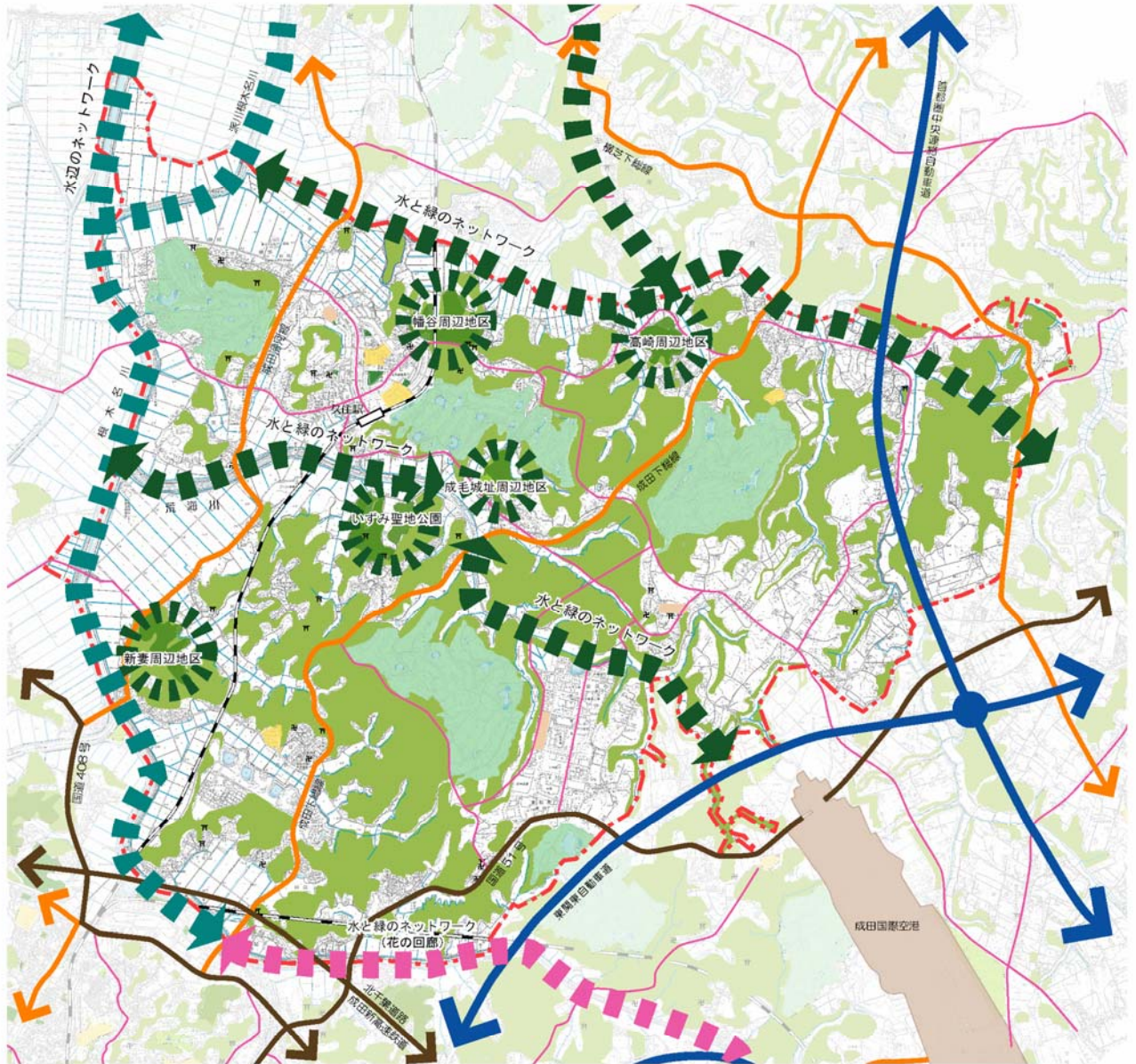
図 中郷・久住地域の緑化推進方針