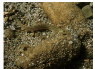
川底にはドジョウが見られる