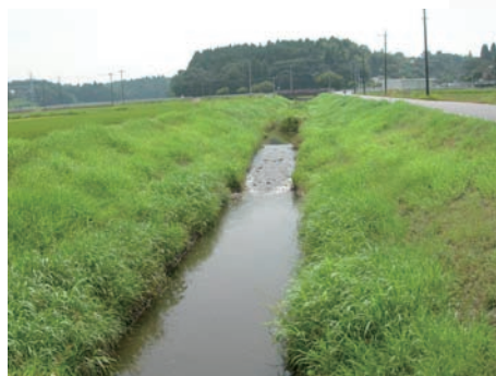
カワセミが多く見られる江川