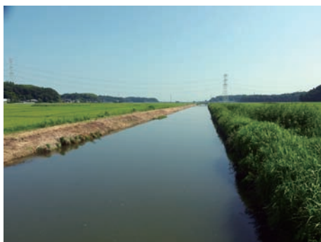
ゆったりと流れる大須賀川の下流域