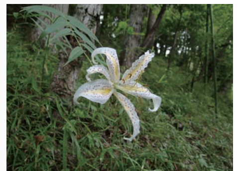
雑木林の斜面に咲くヤマユリ