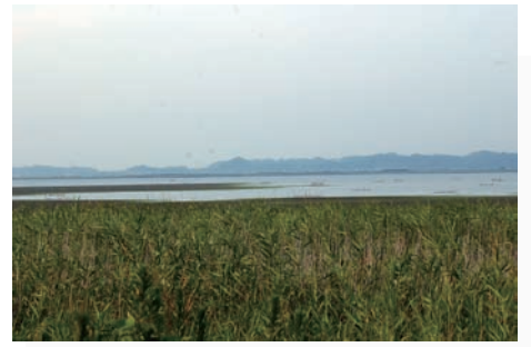
ヨシ原が広がる印旛沼