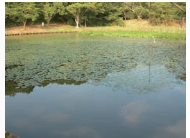
トンボの仲間が多く見られる印旛沼周辺域にある浅間池