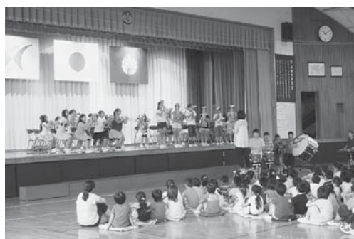
金管部の発表 運動会や敬老会においても演奏