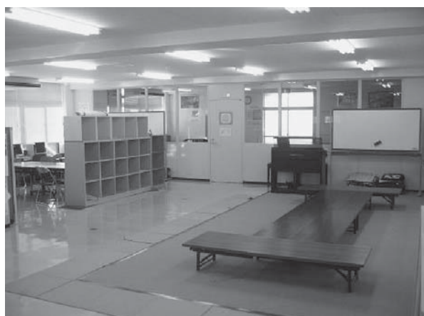
教育支援センター「ふれあいるーむ21」