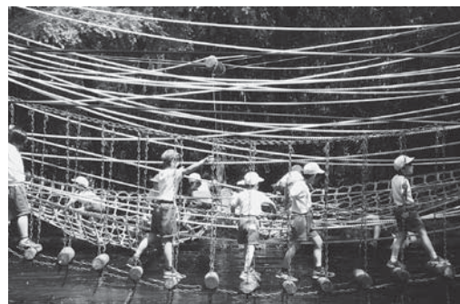
全校歩行会 ～アスレチックで楽しい一日～