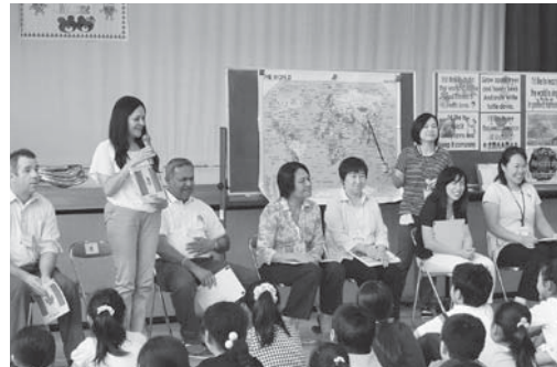
国際交流活動のようす ～英語によるコミュニケーションを通して世界がつながる～