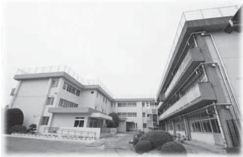
新しくなった南棟

校内研修は算数科を中心に据え、若年層教員が基礎的な教授法を先輩から学ぶスキルアップ研修を行っています。教育課程では、夢を育む活動を計画的に位置付け、芸術文化・科学技術などの分野で本物体験を通して感動を大切にする教育を推進しています。児童活動では、すすくすく班活動等で「WE LOVE NIYYAMA」を合い言葉とし、子どもたちと教師と一緒に愛校心を大事にした学校づくりを進めています。