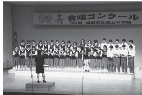
歌うことが好きな有志の集まり「歌い隊」