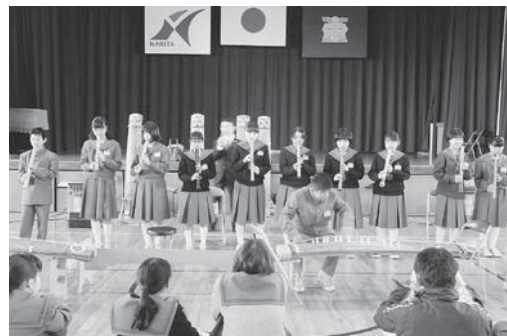
プロの演奏家を招いた邦楽体験教室