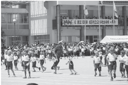
10周年記念運動会 ～10周年記念の横断幕のもと、友達、地域とつながる～

学校敷地内に共同調理場が完成し、4月から稼働しました。毎日できたてのおいしい給食を頂いています。子どもたちが調理場見学をするなど、食育にも生かしていきたいと計画しています。