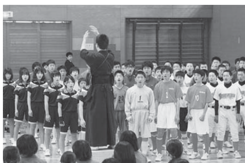
先輩による新入生歓迎会 (歓迎の合唱です)