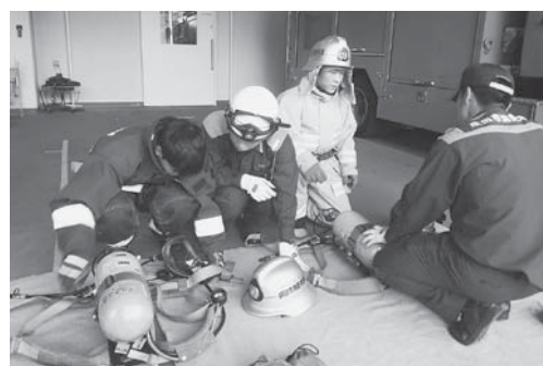
職場体験学習 (2年生の2学期に行います)