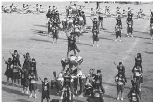
体育祭の全校演技「ソーラン節」のフィニッシュ

本校は、成田国際空港に最も近い中学校です。また、学校周辺は、昔からの純農村地帯と振興住宅地域とが融合した地域です。学区が広範囲であり、9割以上の生徒が自転車で通学しています。交通事故が懸念されるため、交通安全教室や自転車点検等に学校全体で取り組み、事故の未然防止に努めています。また、開かれた学校づくりに努め、学期毎に学校公開日を定め、授業や行事の参観を通して、生徒の成長を見守っていただいています。秋には体育祭、合唱コンクール、年度末の予餞会など生徒にとって充実した行事が続きます。遠山中学区の小学校3校と連携し、生徒指導研修会、ブロック研修会、相互授業参観等を行い、日頃の教育活動に生かしています。また、生徒会活動では「成田いちあったかい学校を創ろう」を合言葉に生徒の自主的活動を推進し、チャレンジ精神を育み、夢の実現に向けて教職員が支援しています。