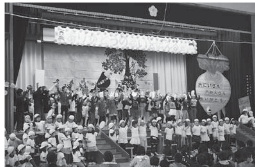
「ありがとうの思いを伝える会」 お世話になった方々へ“ありがとうの思い”を伝えました。