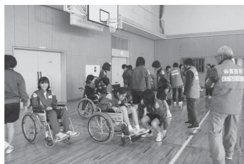
福祉体験学習では、社会福祉協議会の方に講師になっていただき車いす体験などを行いました。