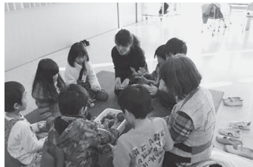
いろいろな昔遊びを楽しみました。