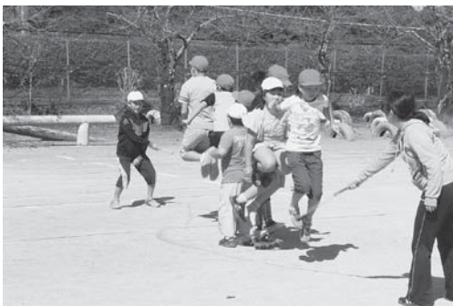
異学年での楽しい運動遊び (杉の子タイム)

本校は、創立144年目を迎え、「心豊かで、自ら学ぶ、たくましい児童の育成」を目標に、保護者や地域との連携を図り、開かれた学校づくりを推進しています。目指す児童像として、「思いやりのある子」「自分で考え進んで学ぶ子」「元気でがんばりのきく子」を掲げ、命を大切に、明るい挨拶ができ、基礎・基本をしっかりと身に付けた子どもたちを育てようとしています。特に「あかるい あいさつ じぶんからさきにおうね 公津っ子」を合言葉とする「あじさい運動」に力を入れ、いつでもどこでも自分から進んで挨拶ができる子どもたちの育成に努めています。また、全校徒歩遠足(手つなぎ歩行会)や運動遊び(杉の子タイム)などの異学年交流(杉の子活動)や地域との交流を年間通して計画的に行い、思いやりの心や協力性・協調性を育てていきます。校内研究では、児童一人一人の確かな学力の向上を目指し、国語科・算数科の研究に取り組んでいます。