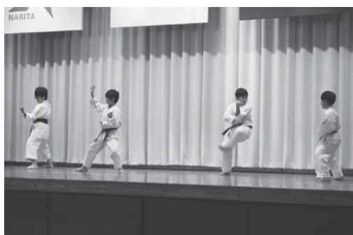
なんでも自慢発表会

昭和50年に成田ニュータウンの南端にニュータウン第3の小学校として開校しました。本校は、橋賀台1～3丁目の集合・個人住宅に囲まれた静かな教育環境にあり、特に碧い芝生と200mトラックのある広いグラウンドが自慢です。『大きく 豊かに たくましく 生きる子どもの育成 -夢をかなえるための土台づくり-』を学校教育目標に、「よく考えて進んで学ぶ子」「おもいやりがりあり助け合う子」「丈夫でがんばりぬく子」を目指す児童像としています。本年度は研究テーマを「読んで 書く力」を育てる国語科学習指導のあり方 ～言語活動の充実をめざして～とし、「よく考え、進んで学ぶ子」の育成に努めています。また、小中連携教育を推進しており、吾妻中学校区3校の児童・生徒、職員、PTAが、それぞれ連携及び交流を進め、各種の地域行事に多数の児童が参加をしたり、学校行事に地域の方に来ていただいたりしています。特に地域で開催される敬老会には金管部が招かれ、好評をいただいています。