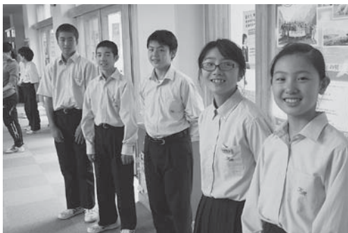
毎朝、生徒会（生活委員会）による挨拶運動を行っています。

校内外からの「熱い思い」をエネルギーとして、4年目の公津の杜中は、大きく飛躍します。