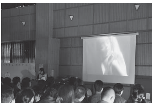
「命の授業」として成田赤十字病院新生児科の先生からお話をいただきました。

本校は、白亜の大きな校舎、広い体育館、陸上競技場など恵まれた施設・設備のもと『文武両道 熱き西中魂』『一生懸命がかっこいい』をスローガンに掲げ、明るく元気に前向きに活動に励んでいます。学習面では「学力の向上」を目標に、国語、数学、英語を中心に、10分間のドリルタイムを毎日位置付けています。また、1年の英語科で少人数学習、全学年の数学でTT（チーム・ティーチング）での授業を行っています。部活動については積極的に取り組む生徒が多いため、教育課程を工夫し、年間を通して活動の時間に配慮しています。学校と家庭との連携については、4月に教育課程説明会を開催して学校経営方針の理解に努め、また8月には、PTA主催で教師と保護者の語らいの場「西中の夕べ」を行ったりしています。本年度も本校の教育目標である「たくましく生きる、心豊かな生徒の育成」の具現化に向け、地域・家庭・学校が一体となった教育活動をさらに推進しています。