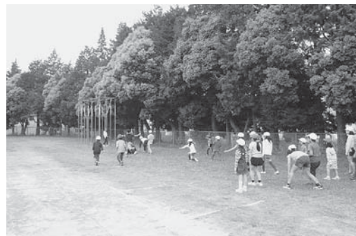
ロング昼休み (縦割り活動)