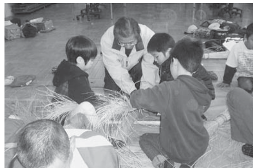
地域の社会福祉協議会の方によるしめ縄作り体験