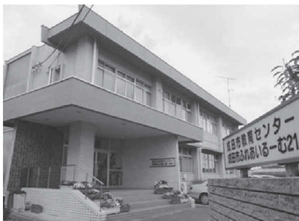
教育センター・教育支援センター

また、担当指導主事、指導員の学校訪問等により、各学校との連携を密にし、通所する児童生徒一人一人の学校復帰の足がかりとします。