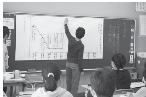
「国語科授業研修会」 心情の変化を読み取り、グラフに表しています。