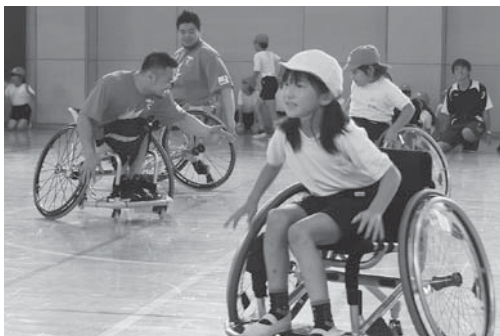
「パラリンピアンとの交流教室」車椅子バスケット選手の皆さんと車椅子の体験をしました。

昨年度は「本物に触れる機会」を数多く設定し、子どもたちに感動を与えることができました。本年度も、様々な教育活動や学校行事を通して感動する心、そして生きる力を育んでいきます。