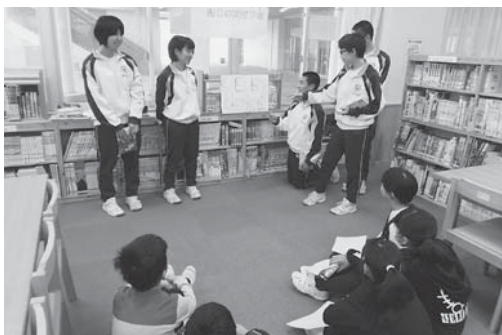
4、8年生合同国語授業（ブックトーク）

本校は、成田市で最初の施設一体型の小中一貫教育校として平成26年に誕生しました。義務教育9年間を見通し、途切れることのない一貫した指導方針のもと、一人一人の子どもが着実に学力を身に付け、心身ともに健全で、豊かな人間性と社会性を発揮できる人間として成長していけるよう連続した学びを実践しています。そのために、9年間で、前期（1～4学年）、中期（5～7学年）、後期（8・9学年）の3つのブロックに分け、それぞれの発達段階に応じた学習面・生活面の目標を設定して教育活動を行っています。毎日の清掃活動をはじめ、多くの教育活動の中で異学年交流を図り、上級生は自己有用感を養い、下級生は高い目標をもって生活する様子が見られます。本年度は、全学年・全教科に協同学習を取り入れ、互いに認め、高め合える児童生徒の育成を目指しています。