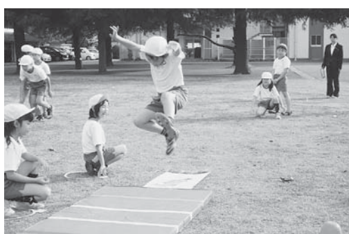
2年 体育科学習 (跳の運動遊び)

成田ニュータウンの中心部に位置する本校は、近年発展著しい飯田町・江弁須地区及び再開発による大規模マンションが建ち並ぶニュータウンの加良部地区で学区を形成し、674名の児童が在籍する大規模校です。また、病気と闘いながら勉強している子どもたちのための院内学級が日赤病院内に設置されています。本年度の学校経営の重点として「子どもが『わかる、できる』学習指導の充実」を定めました。社会科・生活科を中心とした校内研修によって、子どもたちの思考・判断力を育む授業を目指して工夫改善を行います。それによって基礎学力の定着を図るとともに、保護者と協力しながら基本的な学習習慣を育てています。「《夢を持ち 未来を拓く》確かな学力を身に付け、心豊かで健康な子どもを育てる」の教育目標のもとで、本年度も学校・保護者・地域が一致団結して「よく遊び よく学び よく働く からべっ子」を育てています。