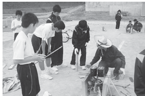
今年度、1、2学年の校外学習では飯盒炊飯を行います。校内でも事前に炊飯訓練を実施しました。