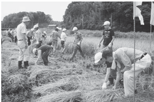
地域の方に教えていただきながら、稲刈りを体験しました。

毎年、5年生では地域の田を借りての米づくり体験、4年生の福祉体験、1年生の昔遊び活動など、地域の方々との交流等を通じて、優しさやいたわりの心、豊かな人間性を育てることを目指しています。