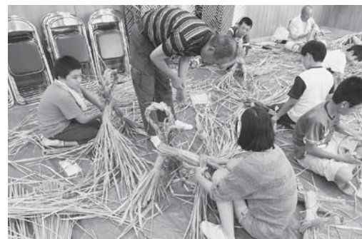
「牛馬づくり」6年生の児童が、地域の方に教わり、伝統の「牛馬」をつくりました。