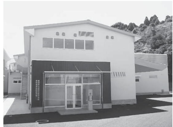
公津の杜小学校学校給食共同調理場

※2 敷地に余裕のある学校に給食施設を設置し、近隣のいくつかの学校に配食する方式