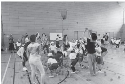
「親子レク」 保護者と職員で企画したレクを親子で楽しめます。

本年度の研究は「文章を正確に読み取り、自分の考えを表現できる児童の育成」を研究主題に据え、多くの情報から重要な言葉や文章を選びぬく力、心情の変化をできごとにそって読み取る力を身に付けた児童の育成を目指しています。