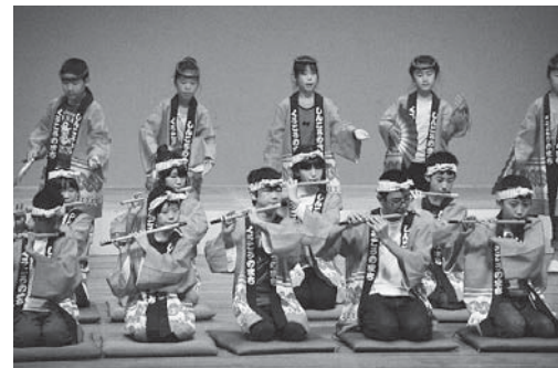
「印旛地区小中学校音楽発表会」