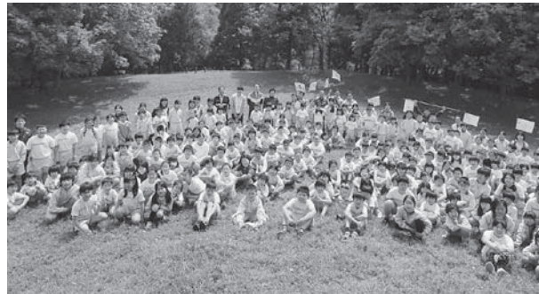
全校遠足 5/2 赤坂公園 すすくすく班で楽しく遊びました