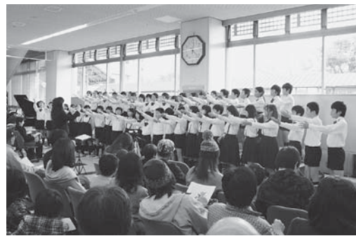
「市役所ふれあいコンサート」4～6年生全員参加の合唱部、今年も練習に励んでいます。