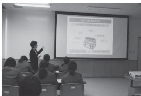
1年生のマナー講座の写真