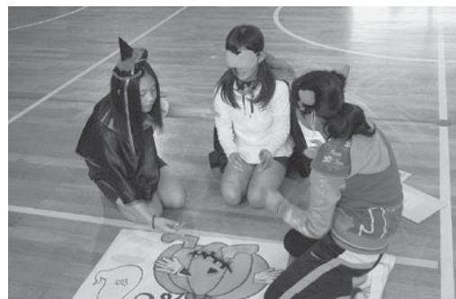
全校で取り組むたてわり交流活動