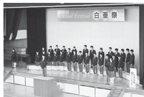
合唱コンクール（白亜祭）