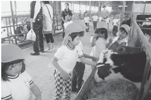
「園外保育」年長組は毎年5月に成田ゆめ牧場に園外保育に行っています。

本園は、成田市の東部に位置し、大須賀川沿いの水田地帯を望む高台にあり、自然豊かな環境に恵まれ、大栄保育園、大栄B&G海洋センター、ナスパ・スタジアム等の公共施設も隣接しています。園児は、大栄地区のみならず市内の他の地域からも通園しており、広々とした園庭で、日々元気いっぱい活動しています。また、園周辺の地域を利用したり、緑豊かな自然との触れ合いを大切にした保育を実施しています。「たくましく心豊かに生きる子どもの育成」を教育目標に、「明るく元気な子ども・自分のことは自分でする子ども・友だちとなかよく遊ぶ子ども・意欲がありねばり強い子ども」の育成に努めています。本年度は、3歳児2クラス49名、4歳児2クラス14名、5歳児2クラス3名、合計66名の新入園児を迎えました。保護者と連携を取りながら、園児が健やかに明るく元気に過ごせるように職員一同、より良い幼児教育に日々努めています。