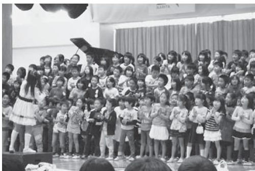
「久住地区音楽交流会」久住小・中学校、地域の歌声サークルが参加し、美しい歌声を響かせました。

本年度は算数科指導の研究を基軸として、基礎基本の確実な習得を図るとともに、児童同士の「学び合い」を通して学んだことを、自らの課題解決に活用する力の育成に取り組んでいます。