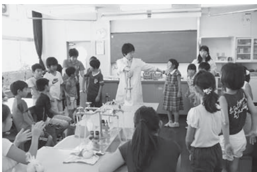
「おもしろ実験教室」

創立32周年を迎える本校は、成田ニュータウン北部にあり、近くには、成田スカイアクセスの成田湯川駅があります。保護者は全国各地から移り住んできていることから、新たなふるさとづくりを目指して「神宮寺祭り」「どんど焼き」などの文化活動や、各種スポーツ大会など独自の行事が定着してきました。保護者の教育的関心は高く、読み聞かせ・環境美化・リサイクル活動・防犯パトロール活動などのPTA活動も盛んです。また、隣接する成田北高校の先生や生徒によるおもしろ実験教室や、綱引き練習などの交流を行ったり、地域の学習ボランティアによる学習会「神小寺子屋」を毎朝開催したりなど、学校、家庭、地域との交流が盛んです。このような地域環境の中、「心豊かでたくましく実践力のある児童の育成」の学校教育目標のもとに、「知・徳・体の調和」を図り「よく学び、よく遊べ、感動いっぱい神宮寺小～一人一人が主役～」を合言葉に全教職員が力を合わせて学校教育活動に取り組んでいます。