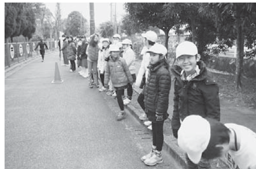
あいさつ運動「笑顔いっぱい」