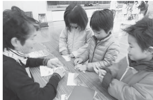
地域のお年寄りと昔遊びを楽しむ子どもたち。 地域とのふれ合いを大切にしています。