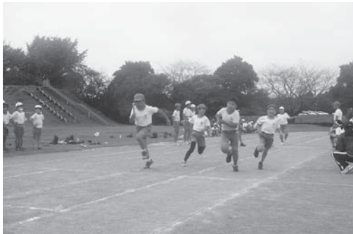
学級全員が心を一つにして ～学級対抗リレー～

本城という地区名は、この地を開発して住み着いた人々が、自分たちの本当の根城にしようという願いがこめられて付けられたといわれています。学区住民は地域の学校としての意識が強く教育熱心であり、学校教育に対する強い期待を持ち、協力的です。『夢と希望を笑顔で語る子どもたち』を合言葉に、一人ひとりの児童が充実した楽しい学校生活を送ることができるよう、学校と家庭、地域の連携を密にして、学校教育目標「たくましく、心豊かな子どもの育成」に努めています。本年度は、(1)心の教育、規範意識の醸成及びあいさつの実践(2)具体的な学力向上策を講じるとともに読書活動や日記の奨励と家庭学習の充実(3)体力向上と基本的生活習慣の定着を重点事項として取り組んでいます。また、「学級対抗リレー」「昔の遊び」「かるた大会」等の活動を通し、人間関係づくりを図るとともに、地域の人材を活用した体験的活動も取り入れて、思いやりにあふれた豊かな心の育成に力を入れています。