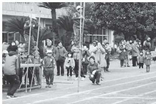
竹馬大会 ～こんなに高い竹馬だって乗れちゃうよ～

本校では、学校教育目標「明日のために、今を精いっぱい生きる子どもの育成（ともに 前進！かがやきっ子）」を達成するために、一人一人を大切にされたきめ細かな指導に心がけ、調和の取れた人間性豊かな児童を育てようと努めています。算数をはじめとする少人数指導、基礎学力を定着させるためのチャレンジタイムの充実、特別支援教育・生徒指導などの推進に力を入れています。また、本物の竹を使う竹馬作りや竹馬大会、餅つき大会、昔の遊び、本年度は創立60周年式典などの地域との交流を深める行事を実施するなど、地域の皆さんとともに歩む学校づくりをしています。また、大栄地区の小学校統合、小中一貫校を見据え、小学校同士・中学校との連携を推進しています。