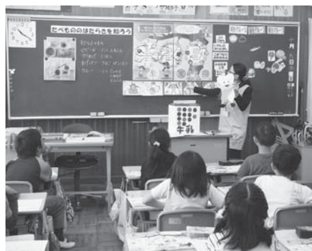
栄養教諭による食の指導

また、子どもを生活習慣病から守るため、家庭に対して、毎朝きちんと朝食をとり、脂肪や塩分をおさえた食事をし、野菜などで食物繊維をしっかりとることなどの指導にも努めます。