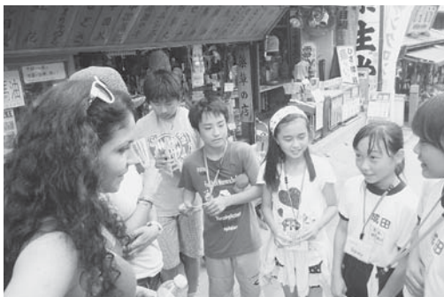
成田山参道での参道活動