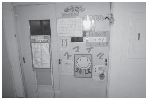
スマイル (通級指導教室)

本校は、教育目標「心豊かでたくましく生きる力を身につけた児童の育成」を掲げ、様々な教育活動に取り組んでいます。本年度のスローガンは「『チーム玉造』で、知・徳・体の調和のとれた教育活動を推進し、教育目標の具現化を図る」です。これを受けて、玉小チャレンジ「挨拶・親切・外遊び」を玉造小の合言葉としています。特に本年度は、昼休みの時間を業間休みと同じ25分間とり、外遊びを奨励しています。また、「玉造小スタンダード」を核とした学習のしつけや家庭学習の習慣化、ドリルタイムや月例テストでの基礎基本の定着などに加え、児童の体験的な学習活動を積極的に取り入れることで、自ら学ぶ意欲や豊かな人間性を育てることを目標にしています。情緒の通級指導教室「スマイル」を核として、一人一人の教育的ニーズに応じた適切な支援の充実を図っています。児童が自分や友達を知り、認め、自他共に大切にする力の育成に取り組んでいます。