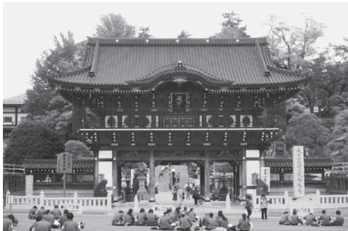
成田山での写生会

「豊かな心を持ち、正しい判断力、実践力をもつたくましい生徒～自立と共生を目指して～」を学校教育目標に掲げ、本年度創立70周年を迎え、成田市内で最も歴史のある中学校として伝統を継承しつつ、生徒会を中心に生徒活動の充実と学力の向上に取り組んでいます。美術の授業の一環として成田山新勝寺の境内の写生会やボランティア活動として太鼓祭り、弦祭りに参加して外国人に成田を紹介するなどの活動を通して郷土を愛する気持ちを育てています。生徒会は、「進化する成中 ～服装・態度・いじめ0～」を掲げ、主体的に生徒自らより生活しやすい学校環境にしようと各委員会が活動しています。授業では、「わかる授業」「楽しい授業」のために生徒の視点に立った授業の手立てや約束事を徹底し、学力向上に取り組んでいます。上記を中心に生徒の良さや頑張りをしっかりと認め、勇気付ける取組を継続するとともに、一人一人の生徒を職員全員で見守り、指導していく体制を構築しています。