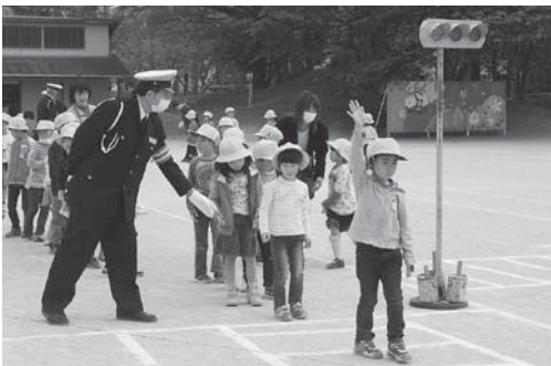
「1年生の交通安全教室」 命を大切にするための、安全な道路の横断を教えてくださいました。

本校は、成田ニュータウンの北西部にあり、成田空港開港と同時に誕生して創立39年目を迎えました。学区周辺には多くの古墳が点在し、グラウンドにも4基の古墳があります。本校の学校教育目標である「みんな仲良く たくましく」は、子どもたちの合言葉になっており、「思いやりのある子 喜んで働く子（徳育）」「自ら学びとる子（知育）」「健康でたくましい子（体育）」を育てるため、元気なあいさつや勤労・生産活動、数学的思考力・表現力の育成、個に応じた運動や健康で安全な生活習慣の獲得に日々取り組んでいます。特に、一人一鉢運動や縦割り清掃、様々な業種の方をお迎えするキャリア教育「人生の先輩から学ぼう」を通して、働く喜びや夢を育む取組をしています。また、子どもたちの安全を守るスクールガードあづまや吾妻・はなのき台地区青少年健全育成協議会等の地域の方々の活動も活発で、ふるさと吾妻に支えられた子どもたちが生き生きと活動しています。