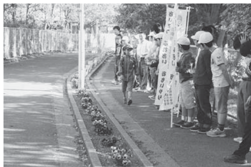
朝のあいさつ運動

3年間「福祉教育の充実」に取り組みました。中台地区の社会福祉協議会の協力のもと、「あいさつ運動」「ペットボトルキャップ回収運動」「花植え活動」など継続して活動しています。本校を取り巻く環境は整っており、保護者・地域の方々の教育的な関心も高く、活発なPTA活動がなされ、防犯パトロールや読み聞かせのボランティアの皆さんからお力添えをいただいています。このような中で、花や緑いっぱいの学校、朝はグラウンドで陸上の練習、校舎からはブラスバンドの音が鳴り響き、笑顔と元気なあいさつが交わされ、授業に集中する姿が見られるような学校を目指しています。