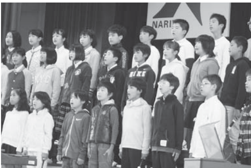
歌声集会「歌声いっぱい」

また、課外活動が盛んで、陸上練習・ミニバスケットボール練習・綱引き練習・金管練習などがあります。さらに、ニュータウンあおぞら会との交流会・生涯大学院の方との昔あそびを通じた交流会など「地域と共に歩む学校」を目指しています。