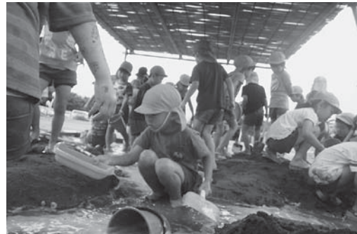
「砂遊び」園児同士協力しての水・泥遊びです。汚れることも気にせず、集中して活動しています。