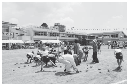
地域の皆さんと仲良く玉入れ～運動会

本年度、学校教育目標を「未来を切り開く 心豊かで かしこく たくましい児童の育成」とし、学校経営の重点を「確かな学力の向上」「豊かな心を育む教育活動の推進」「体力の向上と健康・安全教育の推進」「生きる力を育む生徒指導・教育相談活動の推進」「地域とともに歩む学校の推進」と定め、「一人一人が輝く大須賀小学校」を目指して取り組んでいます。本校の学区は、伊能、奈土地区を中心に9つのブロックで成り立ち、歴史的にも古く、特に伊能地区には由緒ある神社仏閣が点在しています。毎年4月中旬に行われる大須賀大神祭礼においては、本校の児童、保護者、地域住民が一体となり、地域の伝統文化を学校と連携しながら継承しようとする体制が構築されています。また、地域の青少年相談員との連携も意欲的に行っており、その精力的な指導もあり、昨年度は、市青少年交流綱引き大会で見事3位入賞を大栄地区の学校として初めて成し遂げました。