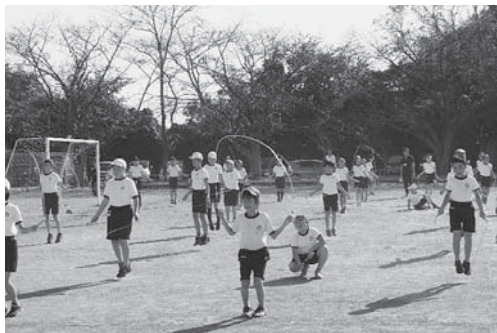
2年生が「遊友スポーツランキングちば」の「みんなで短縄跳び」低学年の部で1位を獲得しました。

全校で「早寝早起き朝ごはん」運動を推進し、すこやかな体づくりを目指して「遊友スポーツランキングちば」に挑戦しています。また、年間を通して下座の演奏に取り組んでおり、3年連続印旛地区小中学校音楽発表会に出場し、素晴らしい演奏を披露しています。