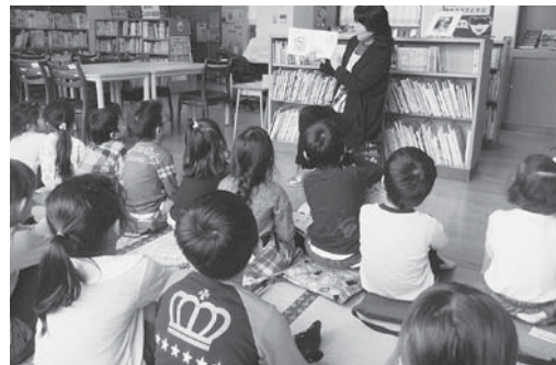
金曜の6校時に司書による読み聞かせ 「へびのみこんだ なにのみこんだ？」