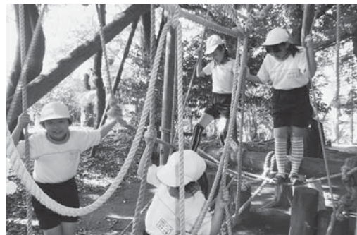
「全校縦割り活動」(10月)「あららぎ集会」アスレチックで交流を深めました。