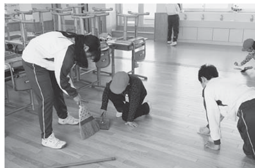
小中学生が協力して縦割り清掃