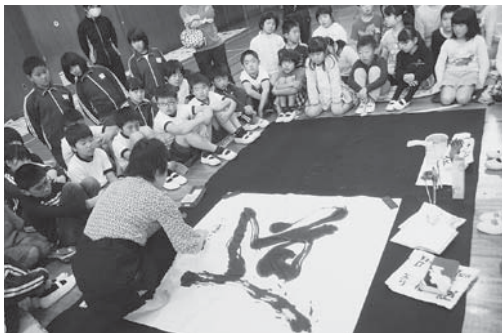
今年の漢字は、「道」です。 これからの未来に「道」を残していこう!!

保護者、地域の皆さんは学校教育への関心が高く、協力的です。そして、地域・保護者・学校が連携、協力して学校づくりに取り組んでいます。また、「すてきな先輩シリーズ」と題して、地域や、本校出身の先輩の皆様に来ていただき、貴重な体験やお話をじかに子どもたちにさせていただいています。その大きな感動が、子どもたちの意欲につながっているように感じられます。昨年度から、金曜の6校時を読書と司書による「読み聞かせ」を時間割に位置付け国語科の研究を中心に取り組んでいます。