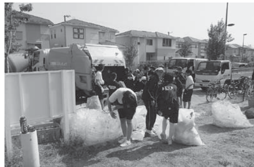
生徒会が主催するリサイクル活動 (毎年、5月に全校生徒が地域に出向きます)