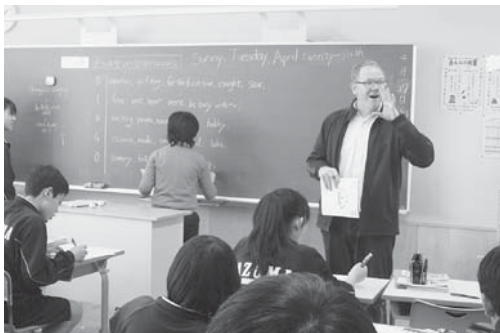
A L T が加わった英語授業 英語教育強化地域拠点事業に係る研修協力校

学校教育目標は「次代をひらき、心豊かにたくましく、生きる力を身に付けた生徒の育成」であり、知・徳・体の調和のとれた人間性豊かな生徒の育成を目指し、職員一同、全力で取り組んでいます。中でも、国際性や実践的なコミュニケーション能力の基礎を身に付けた生徒を育成するために、独自の教育課程を編成し、英語授業の充実を図っています。また、思いやり行動のできる生徒の育成を目指し、生徒会が中心となり、学区の地域の方々とふれあいなながらリサイクル活動を実施しています。