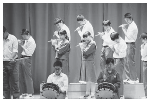
「総合的な学習の時間」の『伝承芸能』