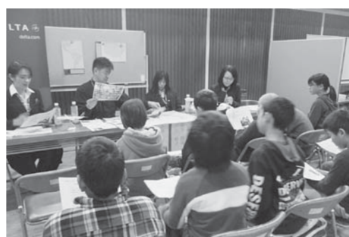
6年 キャリアトーク会 さまざまな職業があること、仕事の面白さを実感することができました。