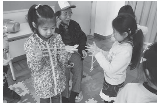
地域の敬老会といっしょに ～昔の遊び～