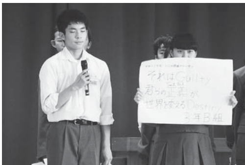
人権教育にも積極的に取り組み、クラスでいじめ撲滅スローガンを策定

本年度は78名の新入生を迎え、全校生徒265名が自主的に取り組むことを目標に、学習に部活動に毎日頑張っています。学習の面では、英語検定や漢字検定等の受検者も多く合格率も向上しています。体育祭、けやき祭等の学校行事への取組や、地域のボランティア活動への参加にも積極的で、地域で行われるクリーン作戦には毎年数多くの生徒が参加しています。平成25年度からの福祉教育の指定を機会に地域との密着力を次第に強くしています。明るく活動的な本校の生徒たちは、志を高くもち目標に向かって毎日努力をし心身共に鍛えています。