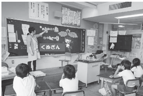
栄養士を講師として行った食育の授業

児童会を中心とした集会や縦割り班活動等、児童が活躍できる場をできるだけ多く設定し、知・徳・体のバランスのとれた児童の育成に努めています。地域との交流も盛んで、各教科・特別活動等における体験活動、社会福祉協議会の方の協力によるグラウンド・ゴルフ大会やしめ縄作りは、児童も楽しみにしています。