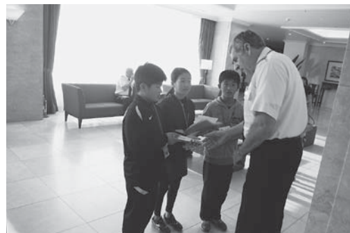
航空会社外国人クルーとの英会話体験 (ラディソンホテル)