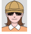
サングラスをかけ人物を特定できないもの