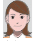
ピンボケや手振れにより不鮮明なもの