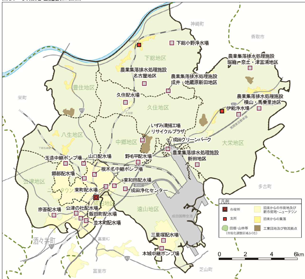
図表 供給処理施設位置図