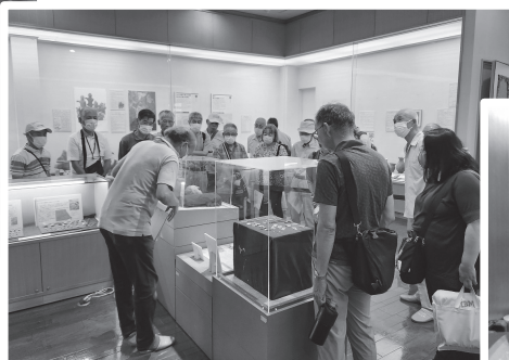
⑩下総歴史民俗資料館を見学