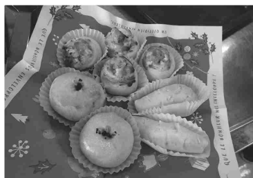
⑳ ふっくらパンの完成