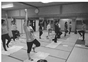
⑲ 託児を利用してリフレッシュ