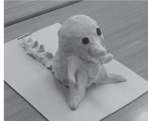
⑦紙粘土の 貯金箱づくりに挑戦