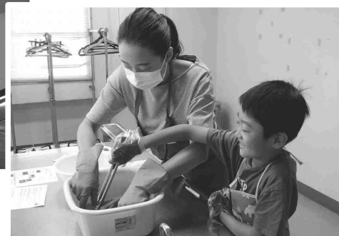
⑱ 玉ねぎの皮で草木染