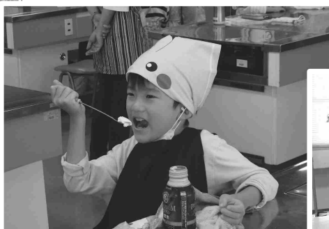
⑰ 自分で作った アイスクリームの味は格別