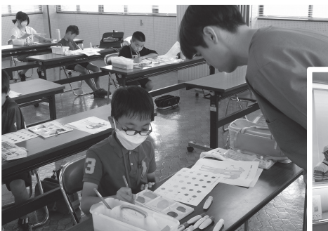
⑧ポイントを教わって筆遣いの練習