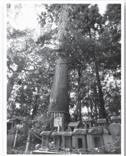
樹齢約700年のご神木

豊住公民館のすぐお隣にある香取神社は、弘安5年(1282年)に香取神宮から分社された歴史がある神社です。毎年4月の第1日曜日には、市の無形民俗文化財にも指定されている北羽鳥香取神社獅子舞の保存会による舞が奉納されます。