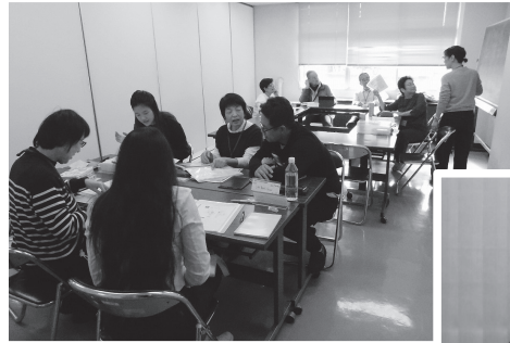
①レベルに合わせて学習