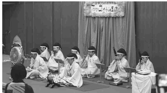
⑮ 雅楽の音色が来場者を魅了