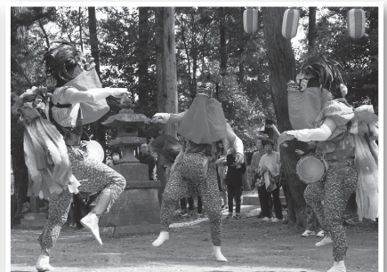
3匹の獅子が勇壮に舞い踊る