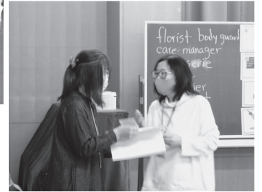
②ペアになって会話の練習