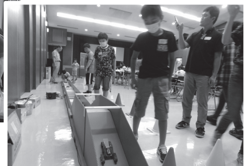
⑫障害物を乗り越えて進むレスキューロボット