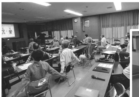
⑯ 「姿勢とバランス」についての講義