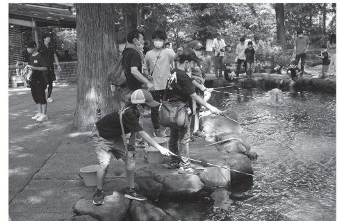
⑥野外活動で釣り体験