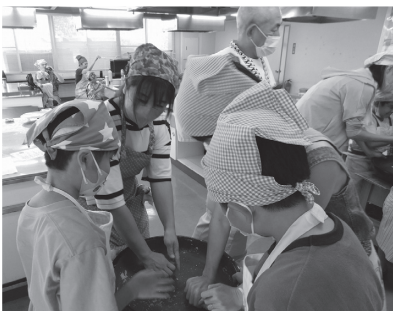
⑬親子で協力してそば打ち