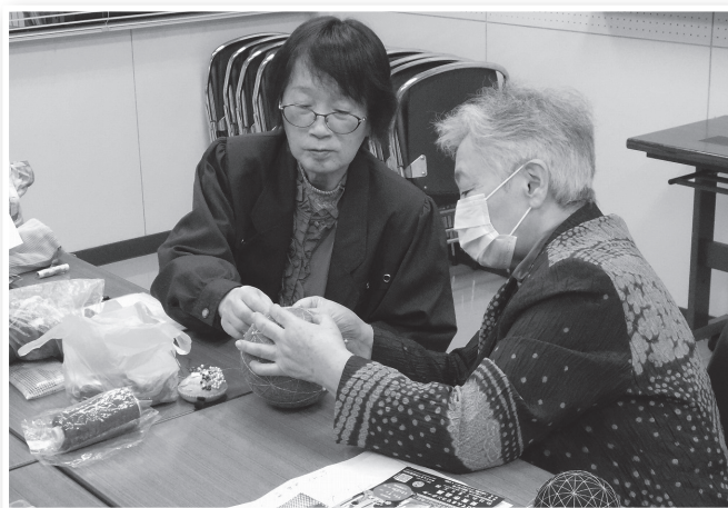
先生からのアドバイス