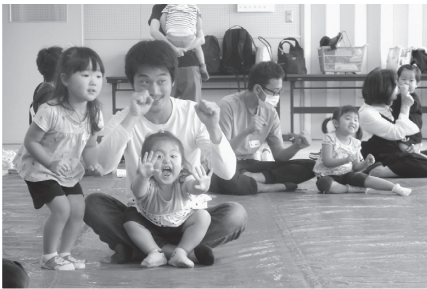
③親子でふれあひあそび