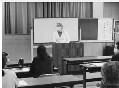
○おもてなし英会話教室

実生活で役立つ講座から、趣味をはじめめるきっかけとなるような講座まで、幅広く開催しています。実際に講座参加者の中からサークルを立ち上げ、活動を続けているケースもあります。