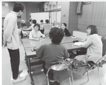
○日本語ボランティアスタッフ養成講座

公民館は、地域に根差し、地域の中核として住民参加を受けて運営されなければなりません。その前提を推進するために、地域のコミュニティを支援する事業を展開しています。特に在留外国人が、地域に溶け込み生活しやすくなるよう、支援することを目的として、「外国人のための日本語教室」を実施します。この講座は日本語ボランティアの皆さんにより運営されていますので、そのボランティアを育成する「日本語ボランティアスタッフ養成講座」も開催しています。