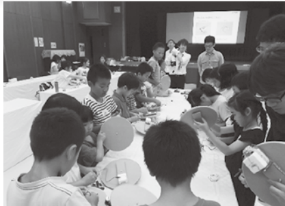
○夏休み親子科学実験教室

青少年（小中学生）に対する総合的な人間形成を目的として、学校ではできないような体験を、公民館で体験する事業です。親子と一緒に楽しく学べる講座もあり、親子の絆を深められます。また、夏休み期間にも多くの講座を開催しており、宿題にも役立ちます。