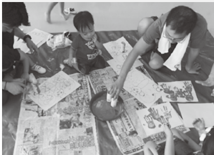
○たけのこ親子広場