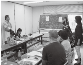
○外国人のための日本語教室