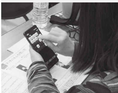
○スマートフォン体験教室