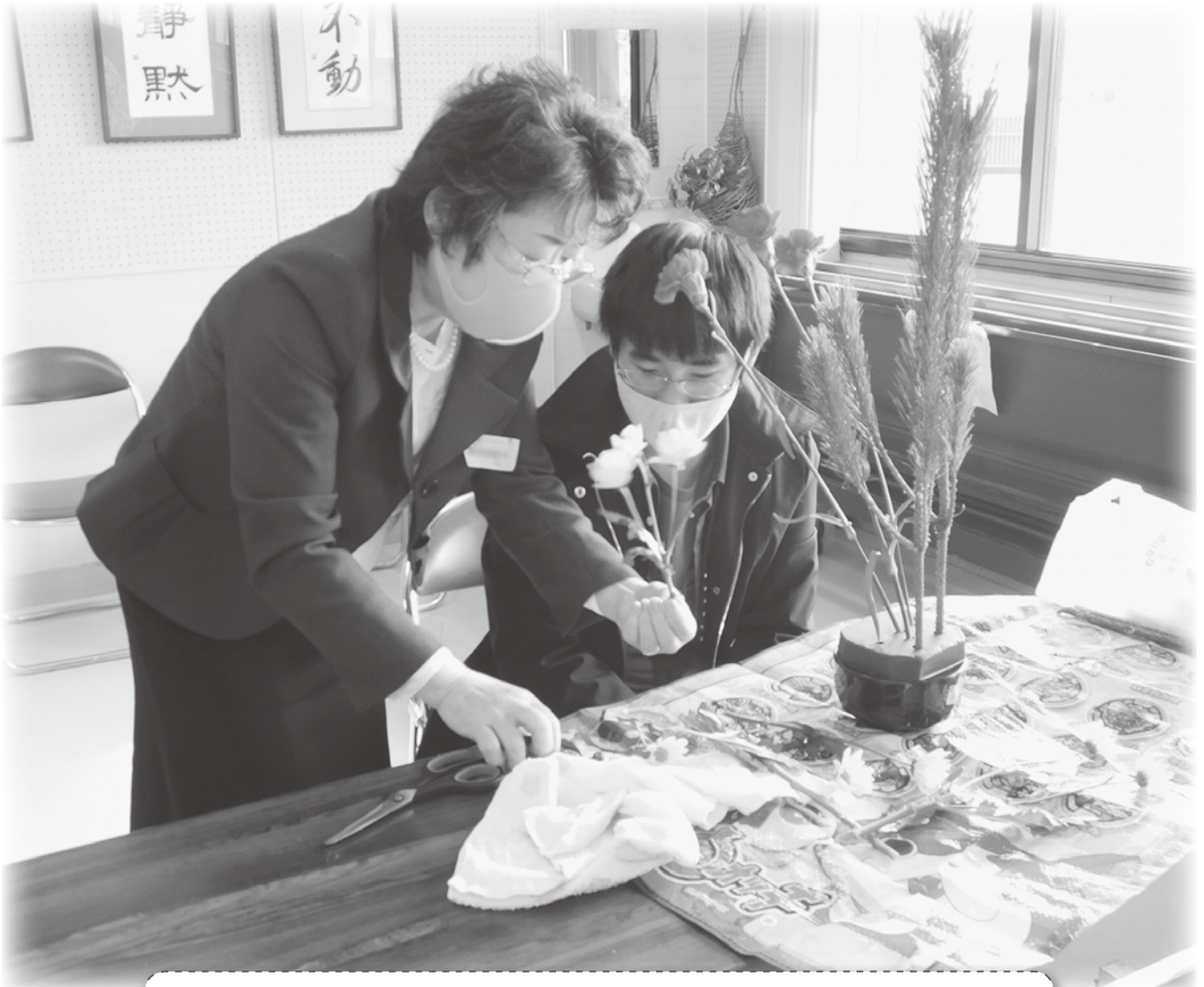
八生公民館「こども生け花体験教室」 講師の指導を受けながら、感性するどく花を生けます