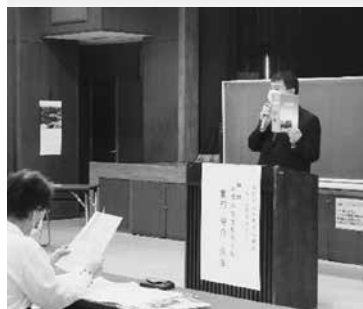
○なりた郷土史セミナー