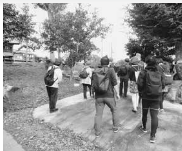
○豊住地区歴史散歩

価値観が多様化し変革する時代の中で、自分たちが住む地域に対する意識も徐々に希薄化してきているように思えます。自分たちが暮らす地域を再度見つめなおし、そこに愛着を見出すことで、ふるさと意識を育むことが大事だと考えます。