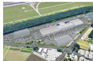
市場の完成イメージ図

工夫による事業展開を求めている。市としては、新市場を訪れた観光客が食事や買い物を楽しめる魅力ある施設を提案いただけるよう、公募条件を精査していく。