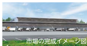
市場の完成イメージ図

入札の延期による影響で新生成田市場の開場は、令和3年の夏頃となる見込みである。また、場内事業者への経済的な支援として、施設使用料や駐車場料金などの激変緩和措置を設けるとともに移転に伴う設備投資や新市場で使用する車両電動化等に対する補助、さらには現在の市場に係る原状回復義務の免除など、事業者の負担軽減策を講じている。