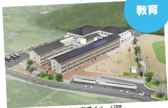
大栄地区小中一体型校舎の完成イメージ図