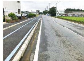
整備中の市道西三里塚大清水線

全ての工区において、用地取得が可能な箇所から施工範囲を決めた上で工事を進めている状況であるが、この路線は遠山中学校の通学路として安全確保の面からも重要であると認識しているため、早期完成に向けて引き続き努力していく。