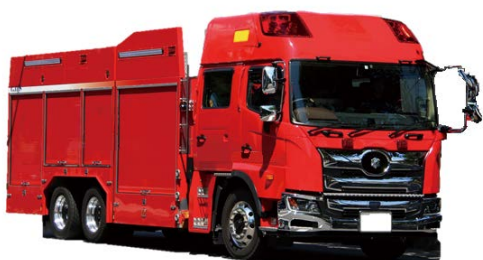
災害対応特殊化学消防ポンプ自動車（IV型）の車両イメージ

また、市有財産の取得では、成田消防署に配備している化学消防ポンプ自動車（IV型）が、購入から22年が経過し、車両の老朽化およびポンプ性能等の機能の低下が著しいことから、消防体制の充実強化を図るため、車両上部に電動放水銃や、液晶モニターのポンプ操作装置を装備する災害対応特殊化学消防ポンプ自動車（IV型）が配備されます。