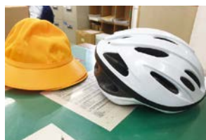
牛久市の無償配布のヘルメット

の交通ルールの掲載、小中学生への啓発物資の配布、あるいは駐輪場利用申請窓口におけるリーフレットの配布や帽子型自転車ヘルメットの展示、購入案内をすることで、自転車利用者のヘルメット着用を推進しており、引き続きヘルメット着用の重要性の啓発に努めていきたい。