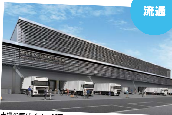
市場の完成イメージ図