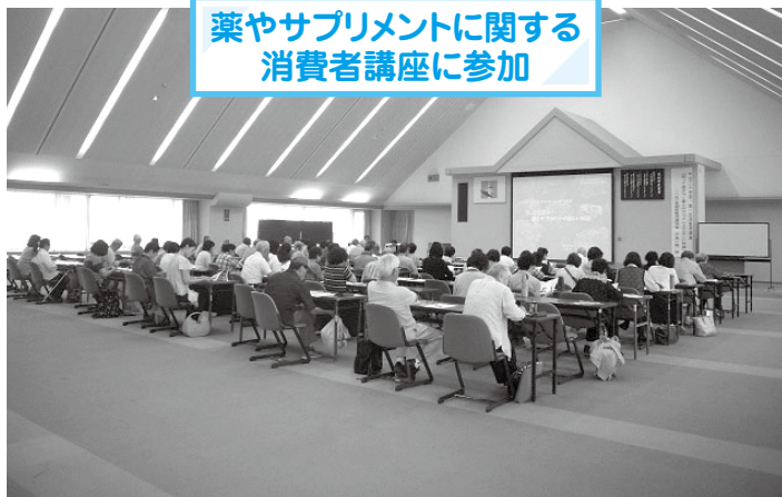
薬やサプリメントに関する 消費者講座に参加