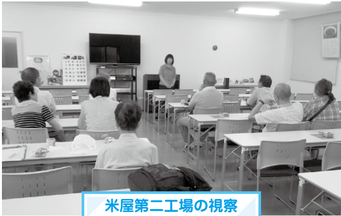
米屋第二工場の視察

4月に委嘱された今年度の消費生活モニター。毎月の会議では、消費生活に関する研修を行い、そこで得た知識を地域での活動などを通じて市民の皆さんに啓発しています。