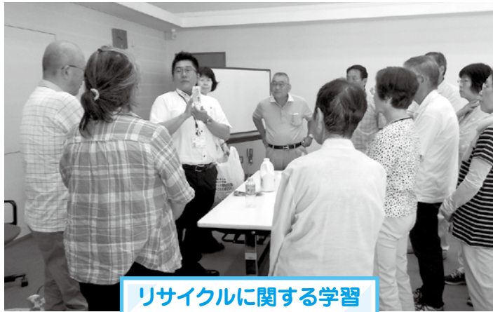
リサイクルに関する学習