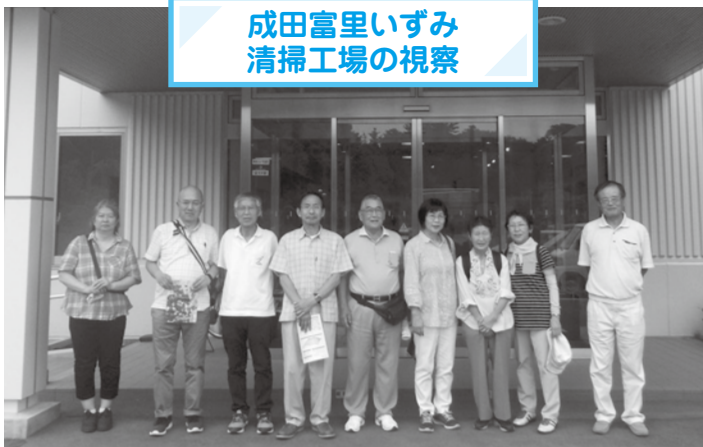
成田富里いずみ 清掃工場の視察