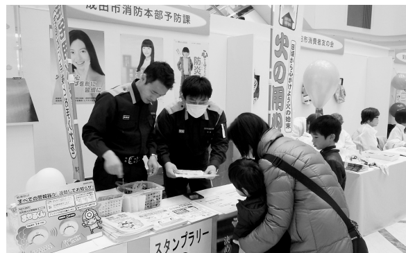
クイズの答え、わかるかな？