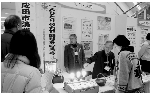
電球の省エネ実験の様子

今回は「できることからはじめよう！私たちの未来のために」をテーマに、消費者トラブル、食品、環境、電気・ガス、住宅といった暮らしに役立つ情報を、来場された方々に紹介しました。また、クイズに答えてスタンプを集めるスタンプラリーを行い、多くの方にご参加いただきました。