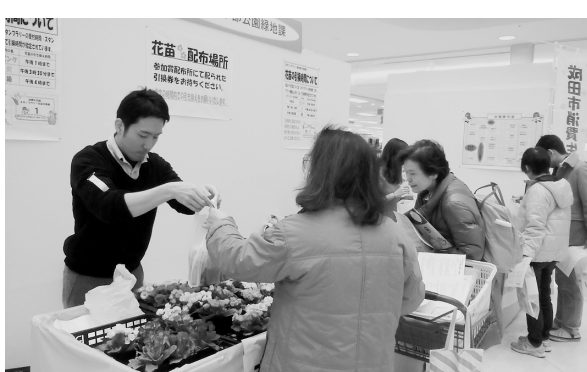
スタンプラリー参加者に花苗や景品をプレゼント