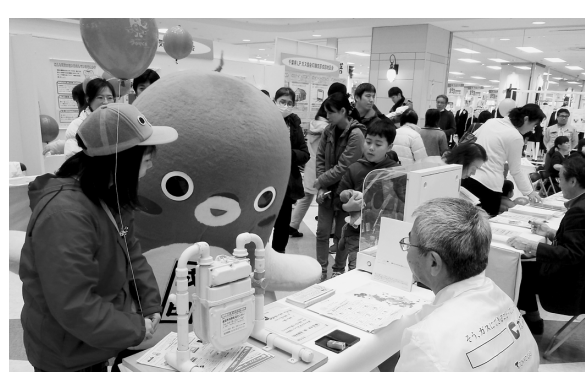
うなりくんもクイズに挑戦！