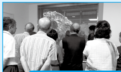
市内視察研修(清掃工場)の様子

消費生活モニターは、消費生活に関する学習会や意見交換を中心とするモニター会議(毎月1回程度)や工場視察などを行い、賢い消費者になることを目指すものです。また、地域の消費者のリーダー、そして消費者と行政のパイプ役として、得た知識や情報を広く啓発していただきます。